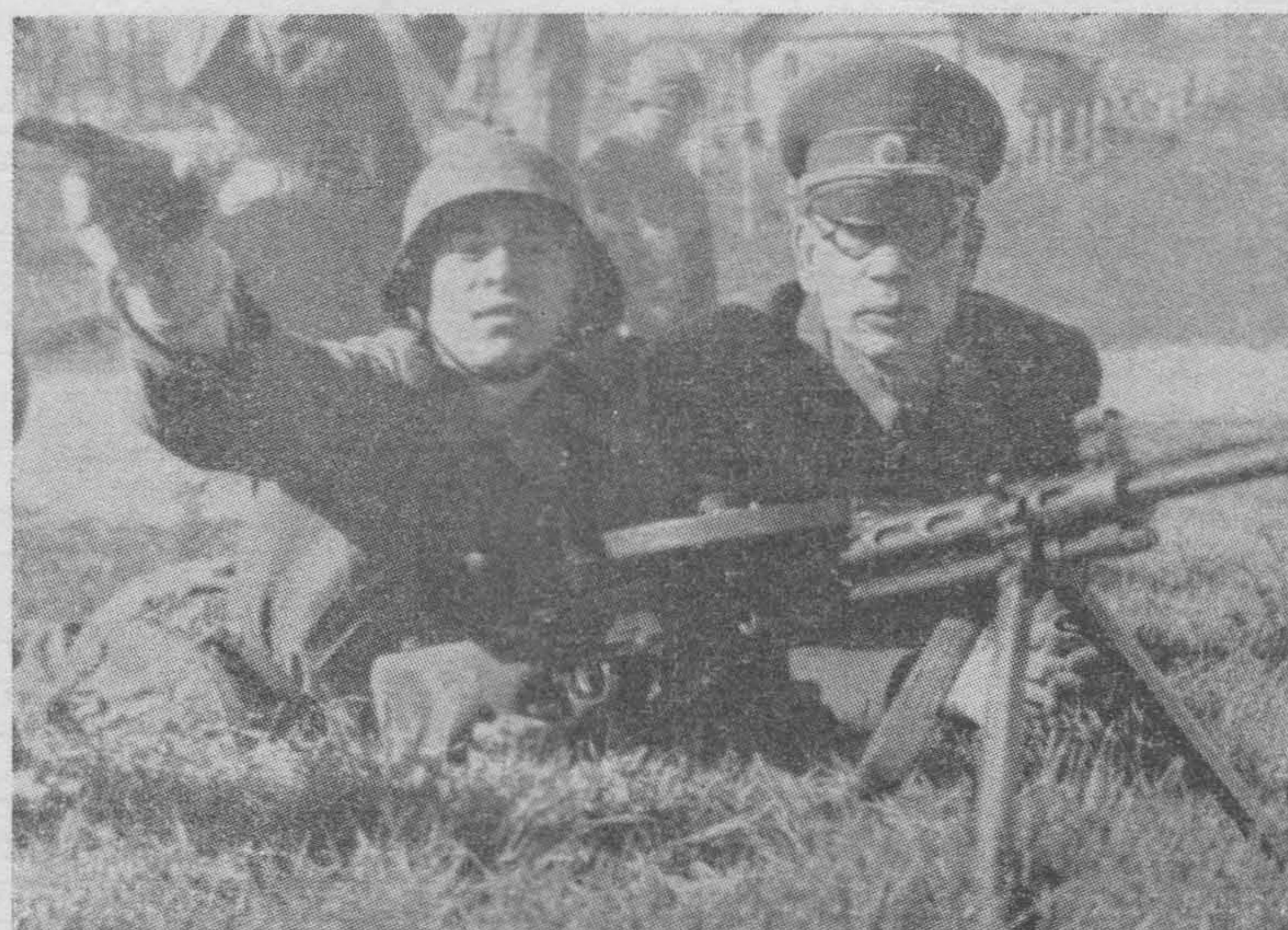
Командир РОА на оккупированной территории

двойное преступление по отношению к людям, которые в 1942 году в Париже и в 1944 году в Праге открыто и во всеуслышание декларировали свои освободительные идеи. Наклеивая этот ярлык союзники Сталина знали к тому же, что обвиненные не могут опровергнуть обвинение, ибо они очутились уже в сталинских руках.