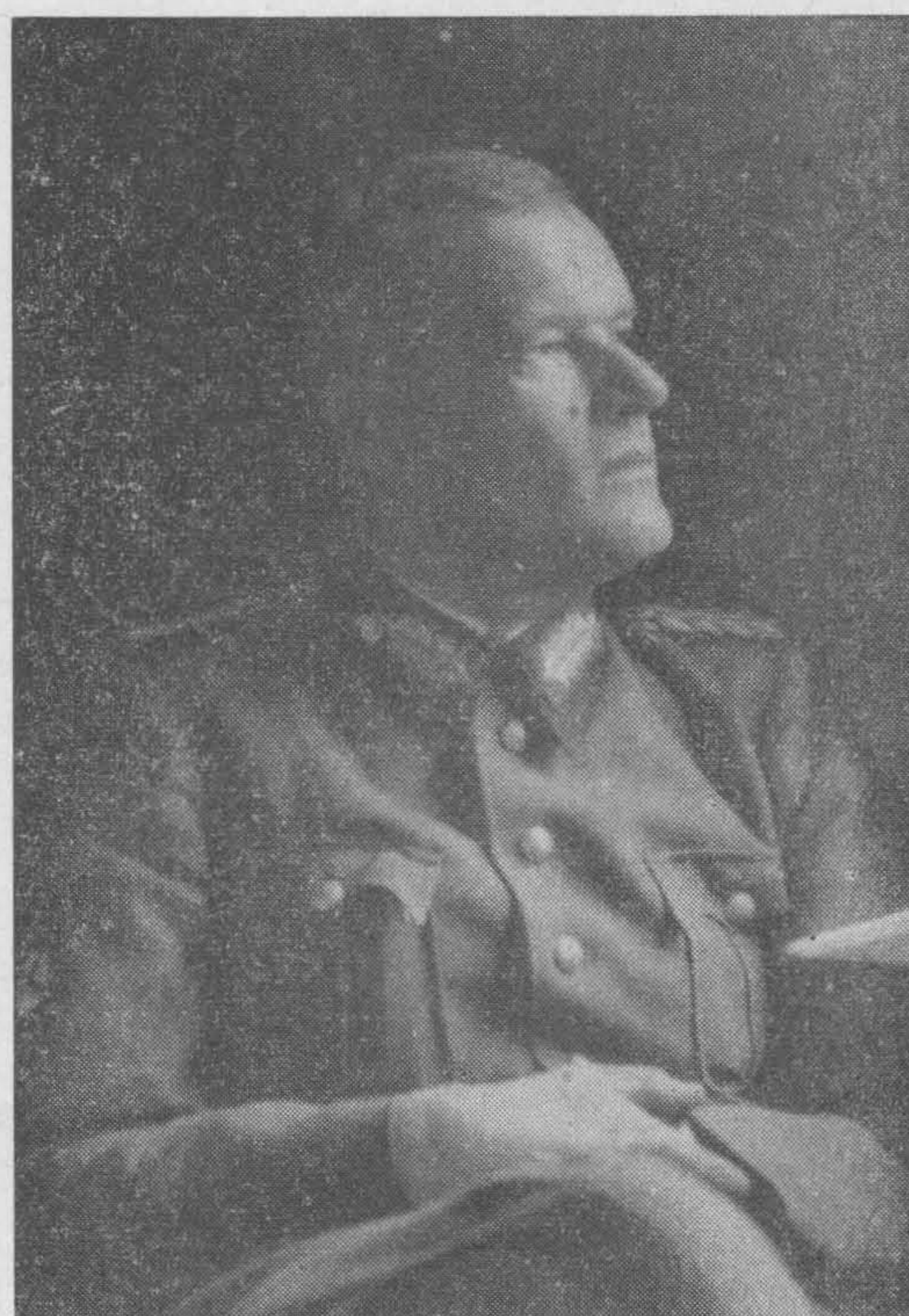
Начальник Штаба РОА генерал-майор Ф. И. Грухин