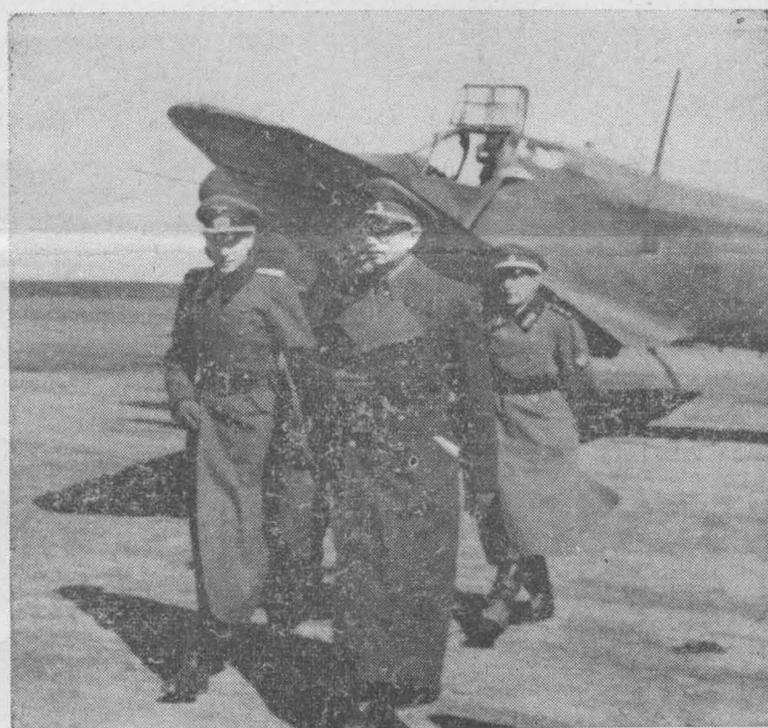
А. А. Власов прибывает на Восточный фронт