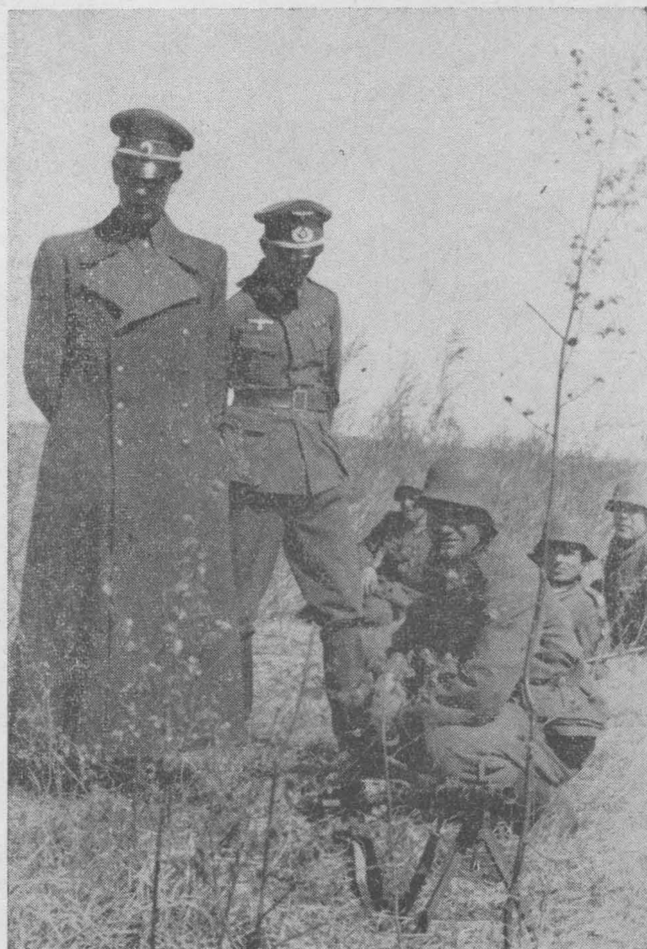
Власов в районе Орши в марте 1943 года