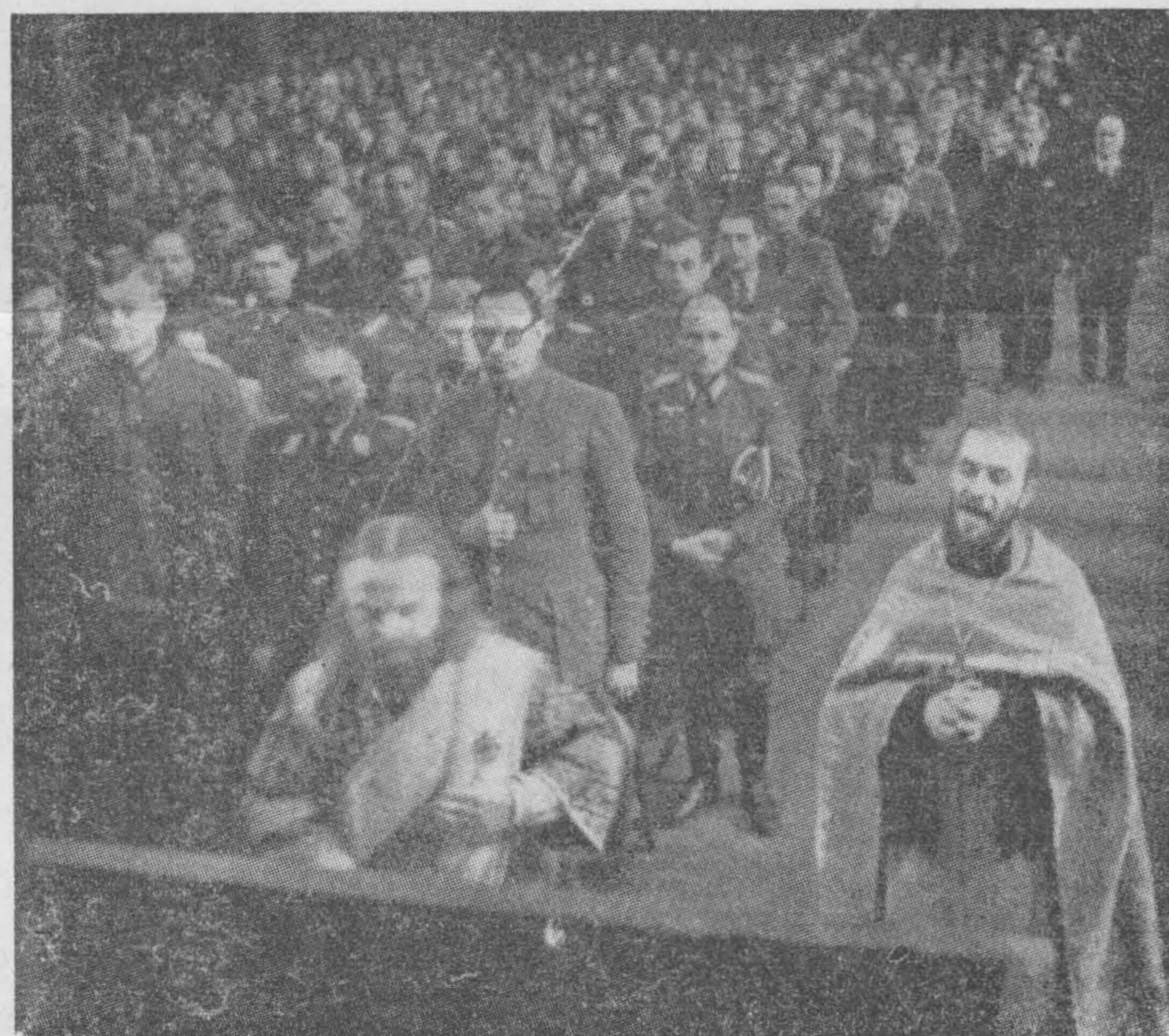
А. А. Власов с ближайшими соратниками присутствует на богослужении