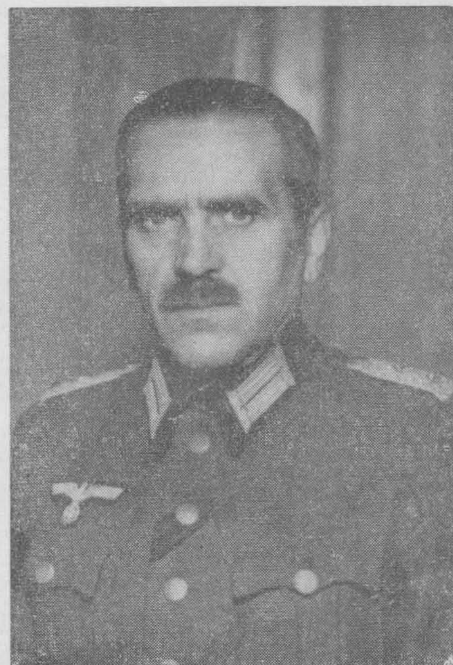
Начальник офицерской школы РОА генерал-майор Меандров