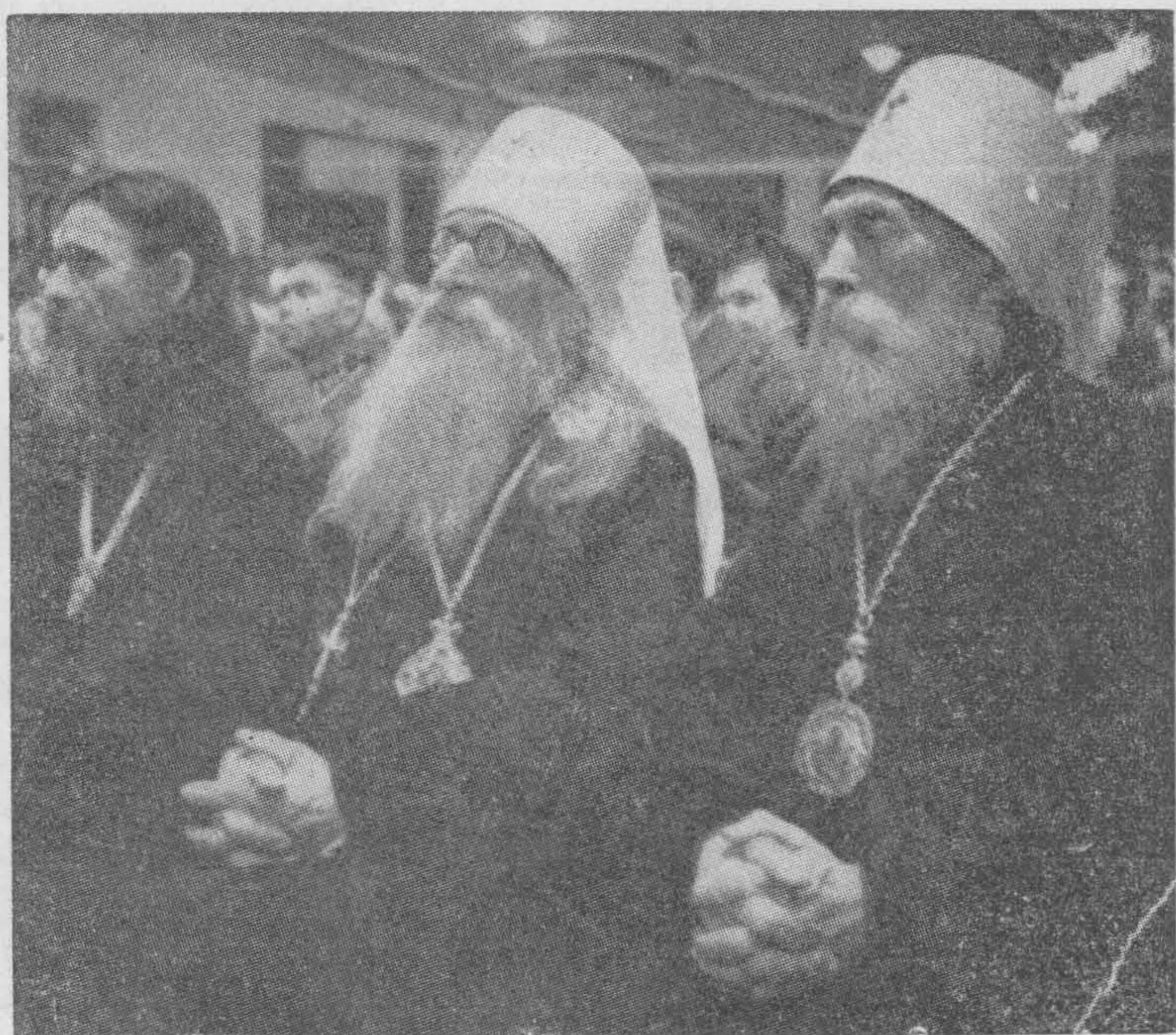
Митрополиты Анастасий и Серафим присутствуют при обнародовании манифеста Комитета Освобождения Народов России в Берлине