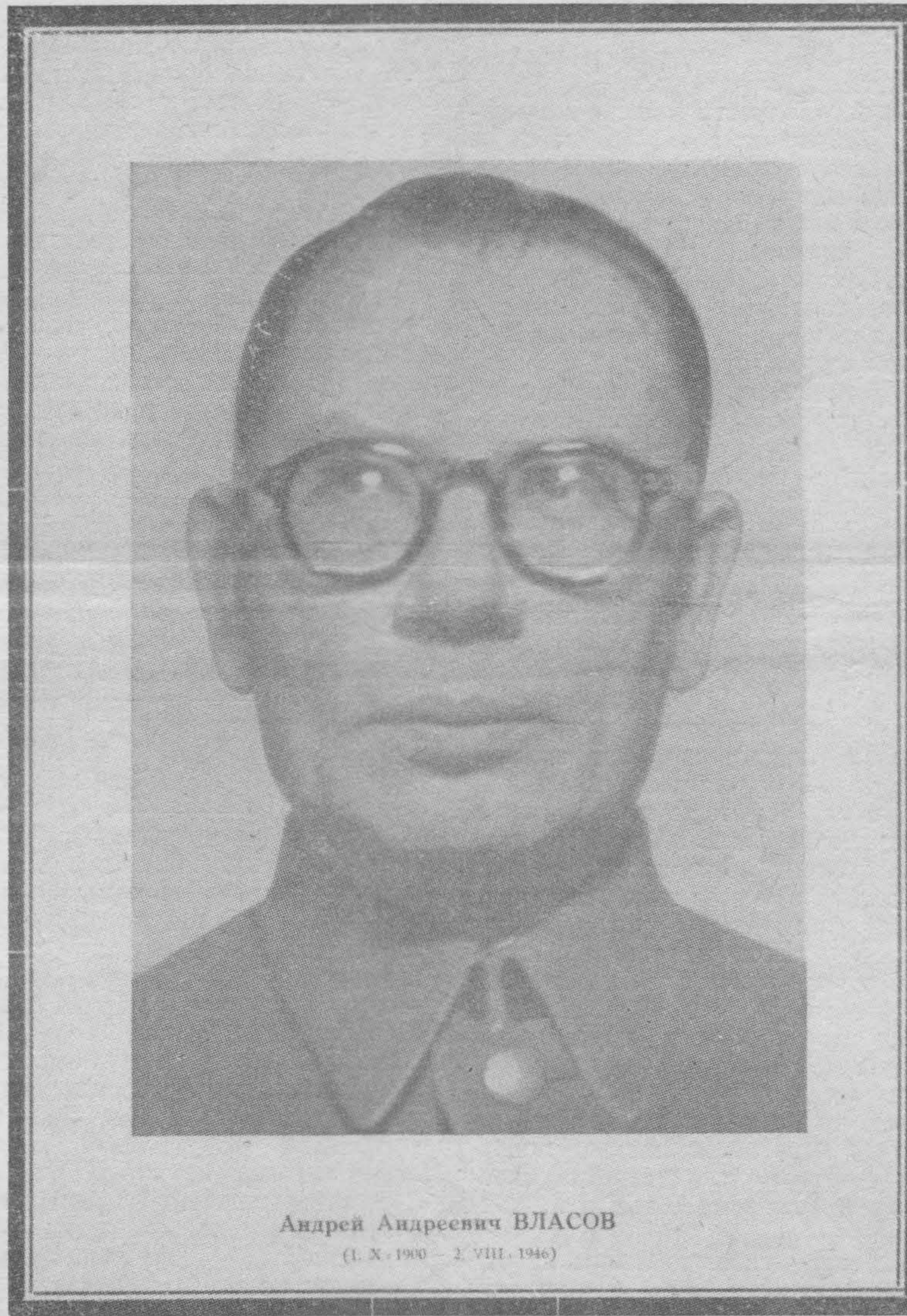
Андрей Андреевич ВЛАСОВ (1. X. 1900 — 2. VIII. 1946)

В этот исторический день, в день тридцатой годовщины гибели наших вождей, мне хочется оглянуться назад и вспомнить физический и духовный облик каждого из них. С болью в душе вспоминаю, с каким спокойствием они стали на тернистый путь освободительной борьбы, и с какой уверенностью каждый из них шел к своей цели. Компромиссов не было и быть не могло. Решение было принято: свобода или смерть! И чашу горечи им пришлось выпить до дна, и сколько горячих сердец, жертвенных идей и несбывшихся надежд ушло с ними в могилы... Тяжелое поражение нанесли в 1945 году Освободительному движению победители-демократы. Вспоминая теперь те далекие сокрушительные дни, представляю себе, какое презрение и омерзение должны были питать Власов и его соратники к тем безумцам, которые своих же единомышленников и благожелателей выдавали на растерзание своим потенциальным врагам. Что думали предатели о свободолобии своих собственных народов, о своих вековых гуманных традициях, которыми они так кичились перед остальными народами, подписывая презренное ялтинское соглашение? Они не задумались над тем, что подписывают смертный приговор борцам за свободу, в угоду палачам и инквизиторам двадцатого века, что своей подписью под соглашением они стали соучастниками большевистских злодеяний и толкнули на гибель не только тех, кто пытался вырваться из коммунистической неволи, но и целый ряд народов Европы. Мало того — чтобы оправдать себя, они заклеили свои жертвы ярлыком «изменника родины» и тем самым совершили