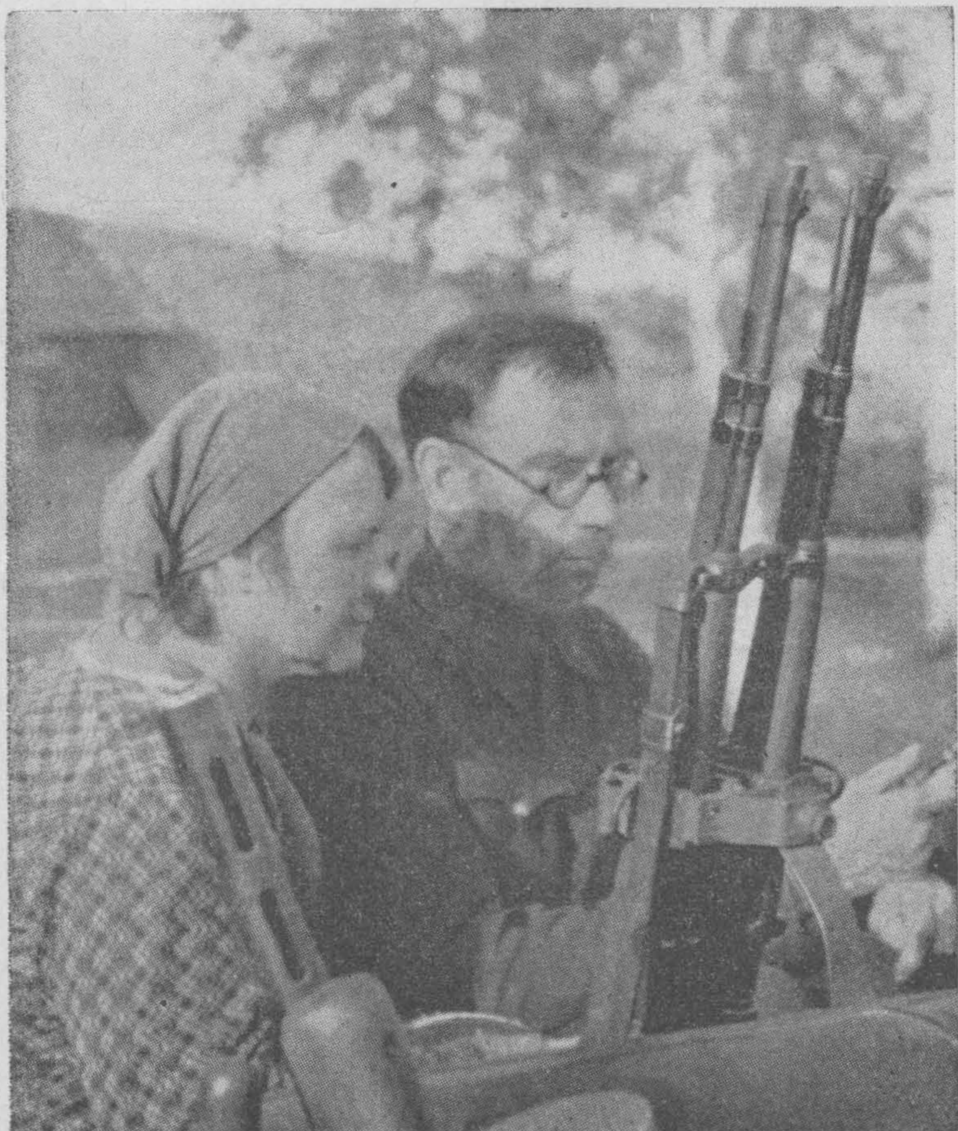
А. А. Власов в первый день немецкого плена