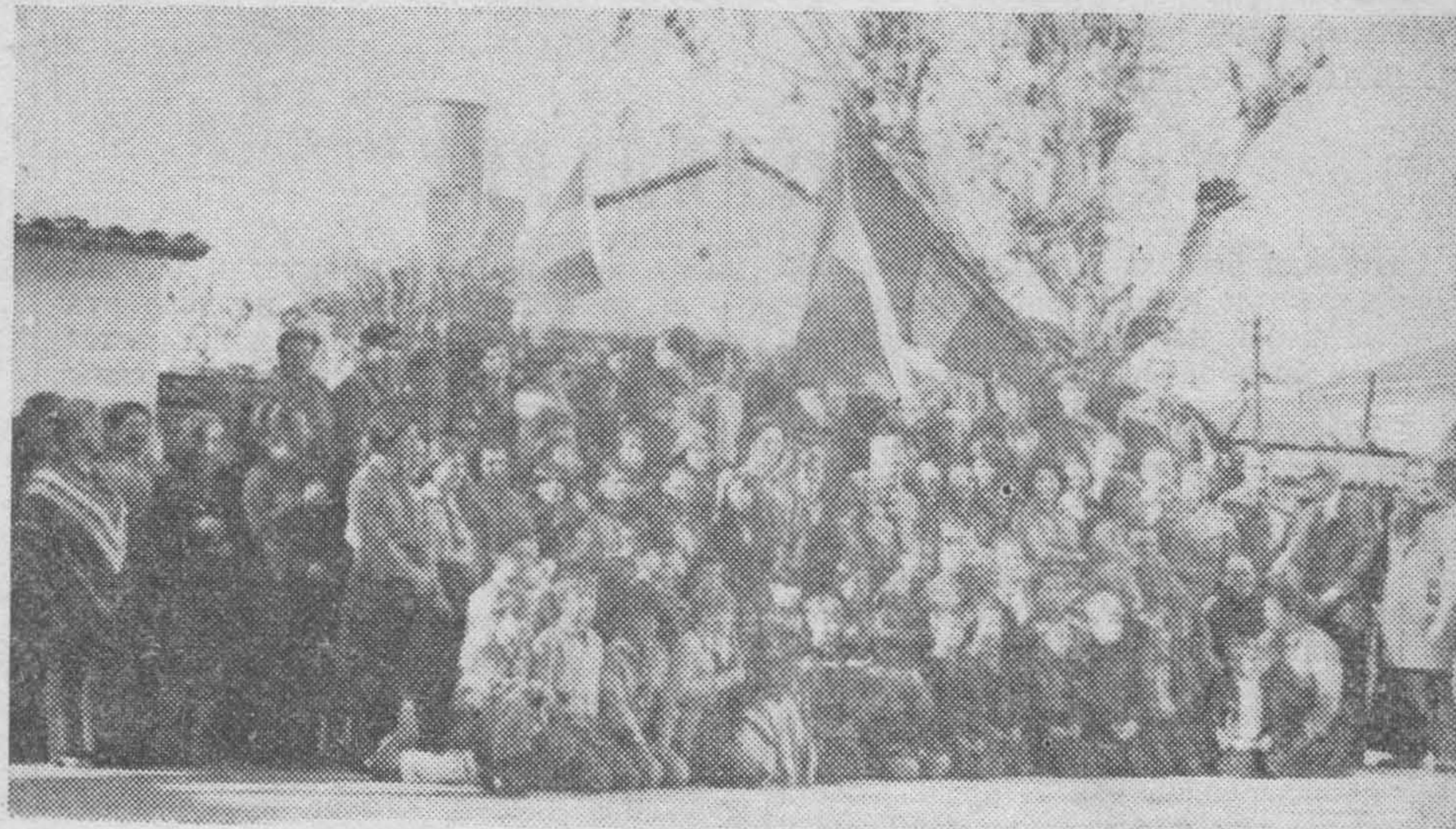
ТАК СЕГОДНЯ в 1980 г.