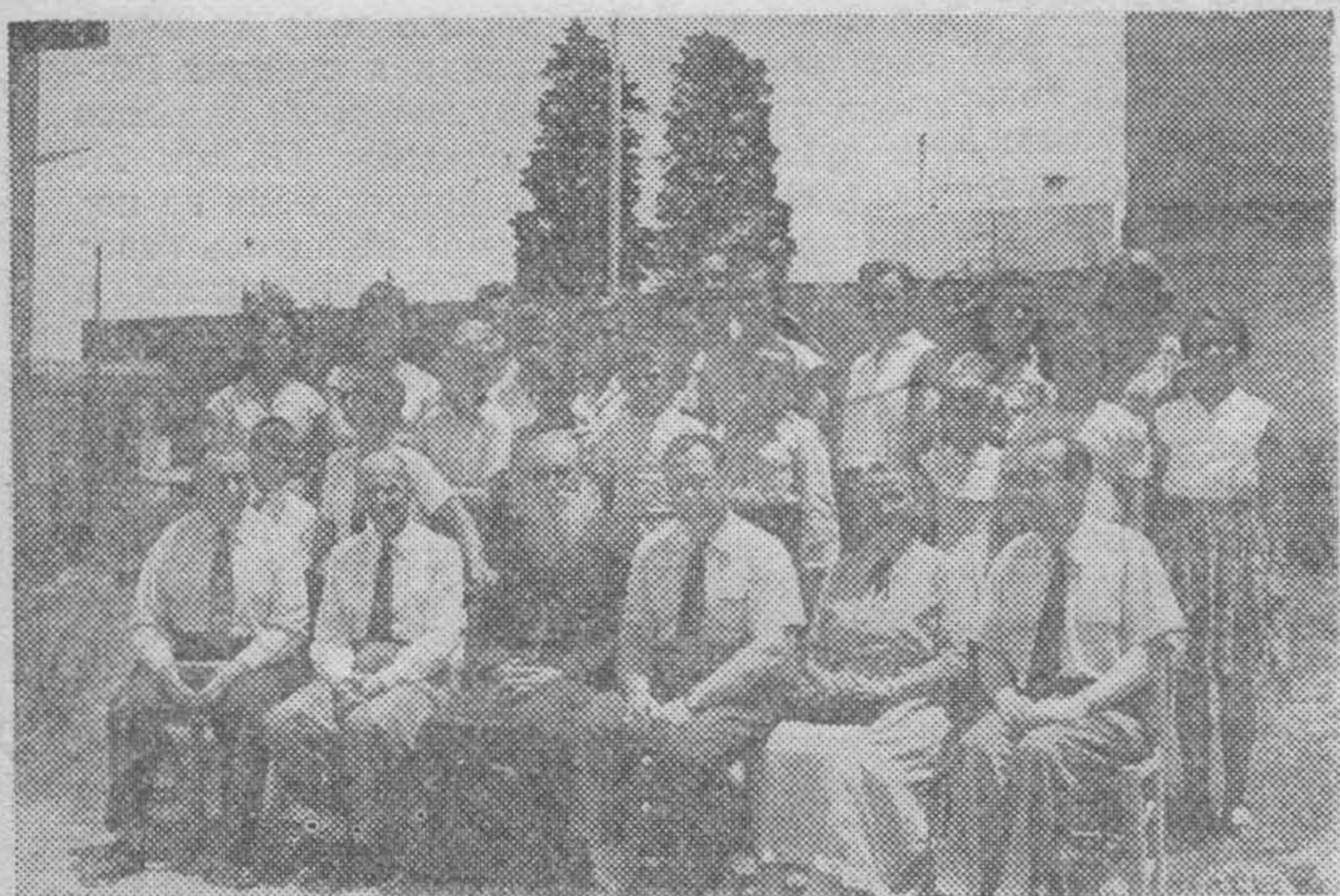
ТАК БЫЛО в 1955 г.