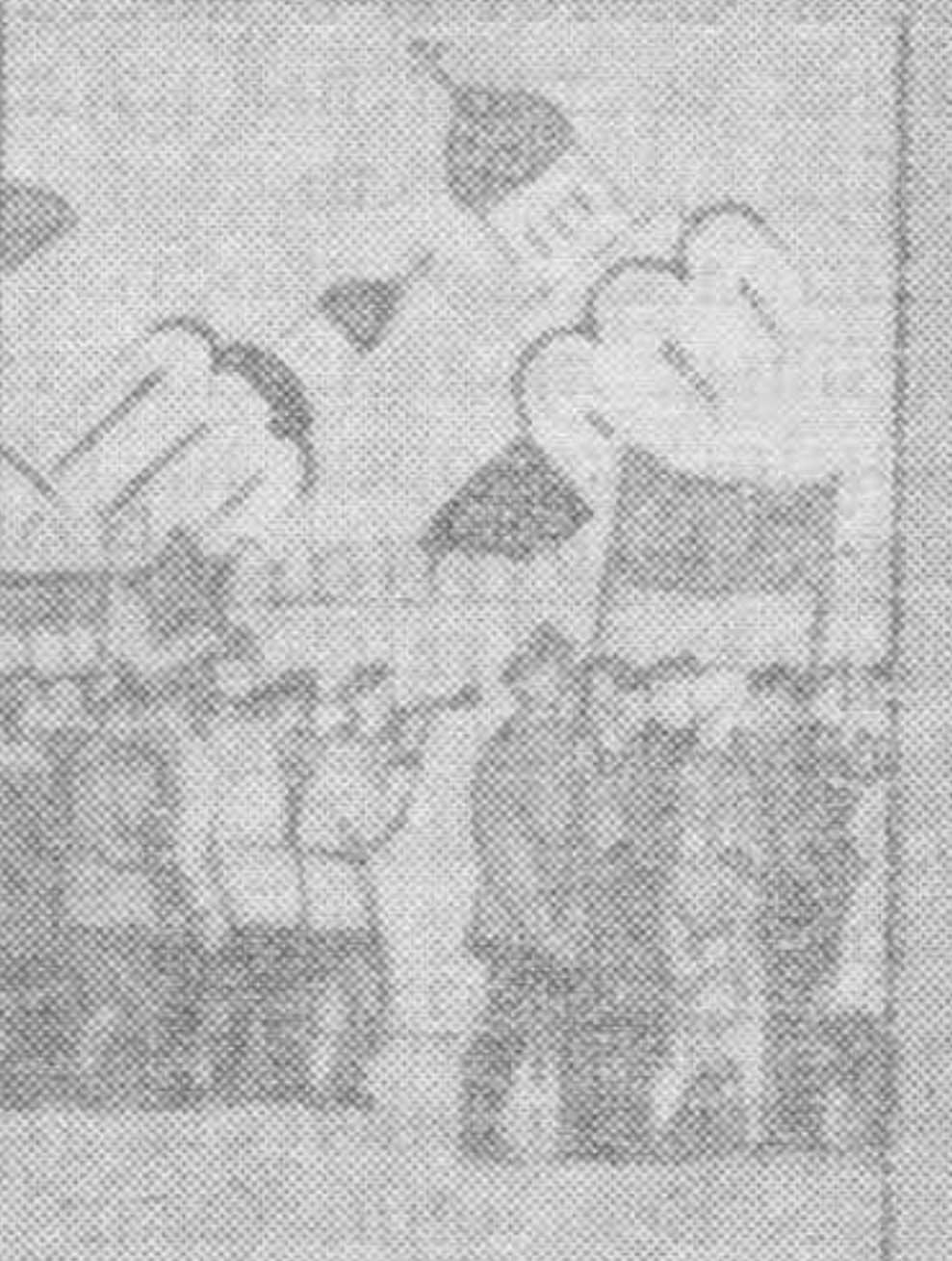
Вспомните святого великомученика Панкратия, который в 306 году в Риме был казнен.