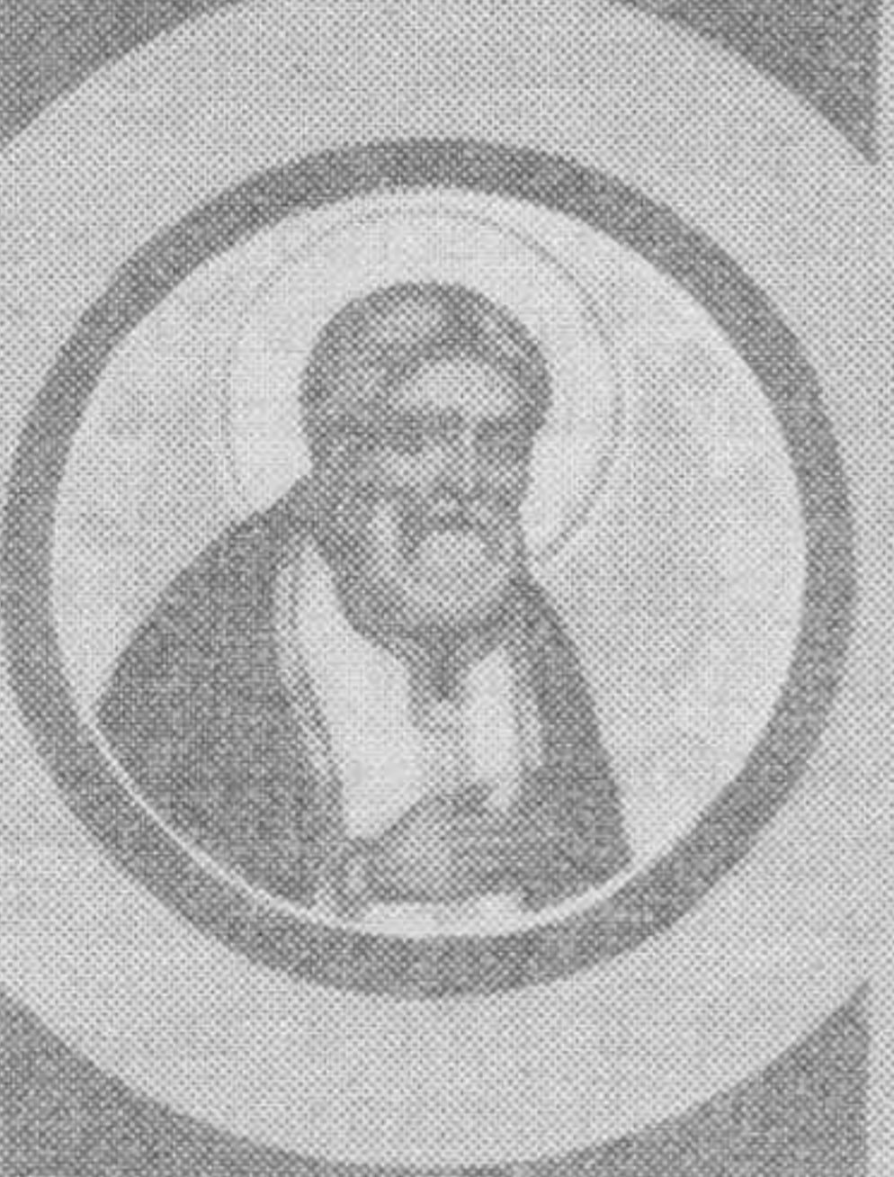
Святой великомученик Киприан.