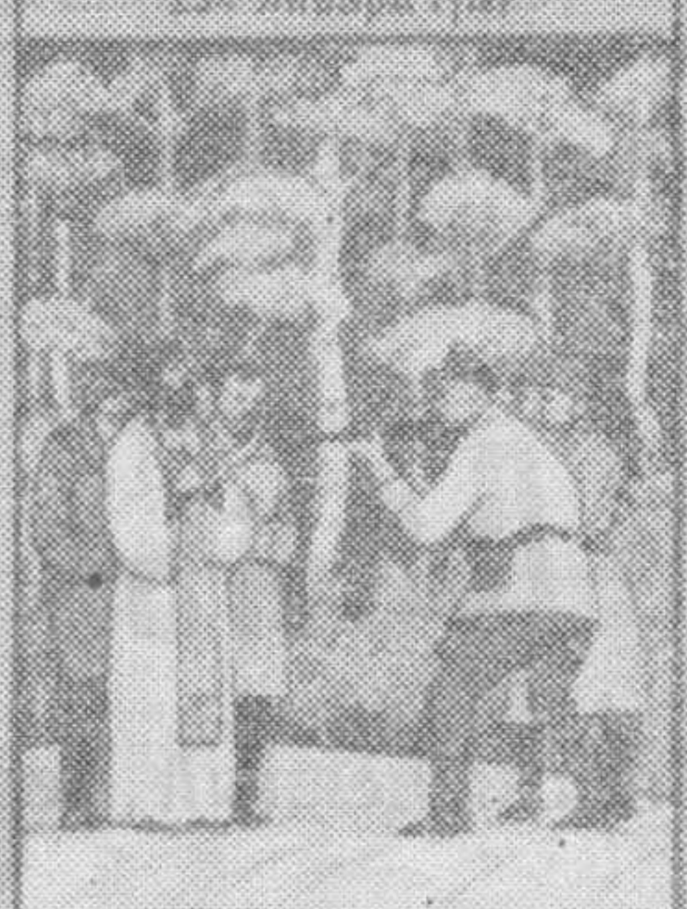
Вспомните святого великомученика Панкратия, который в 306 году в Риме был казнен.