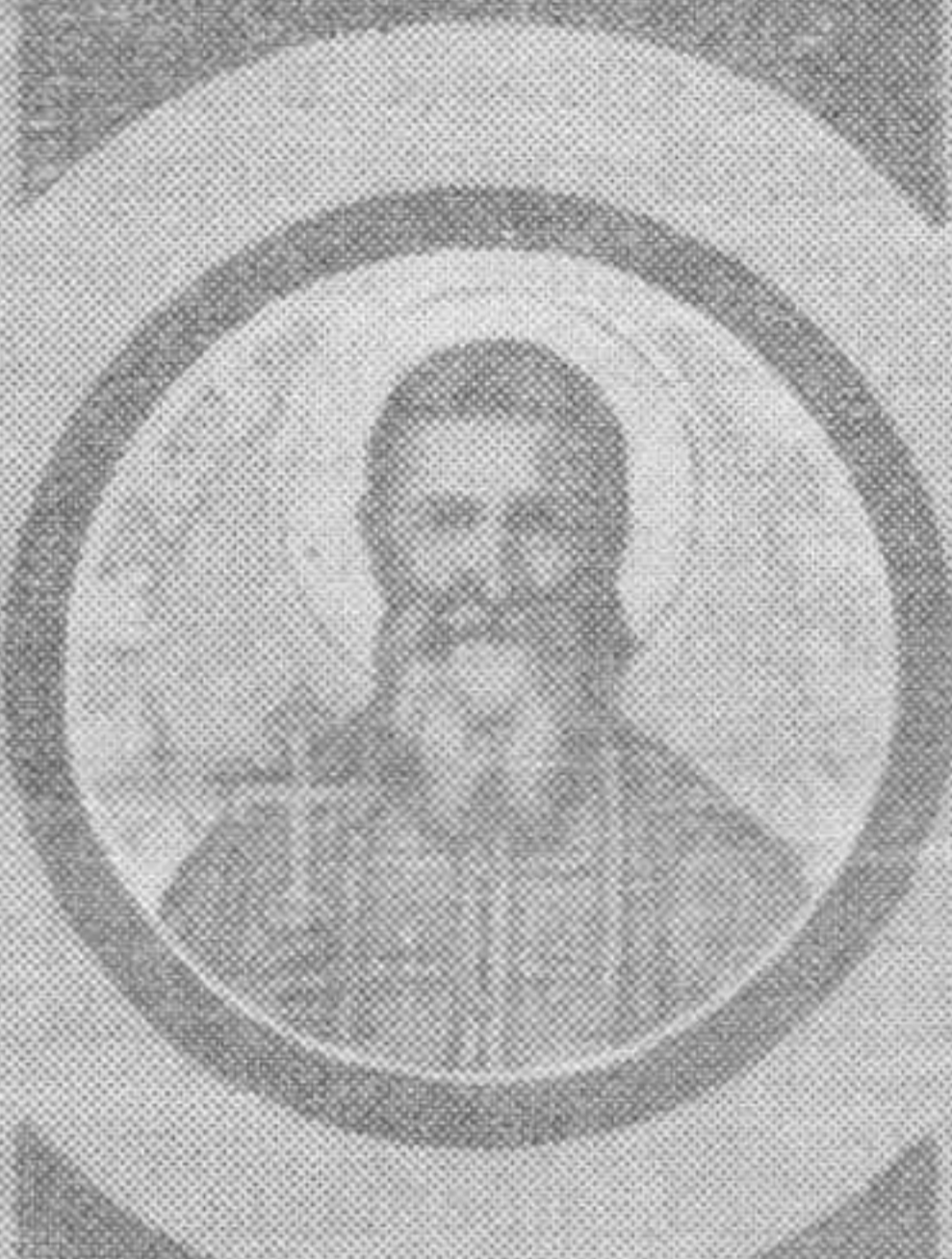
Святой великомученик Панкратий.