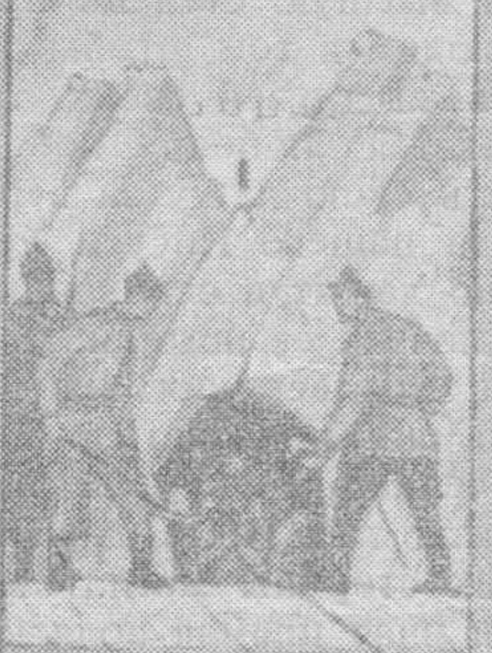
Вспомните святого великомученика Панкратия, который в 306 году в Риме был казнен.