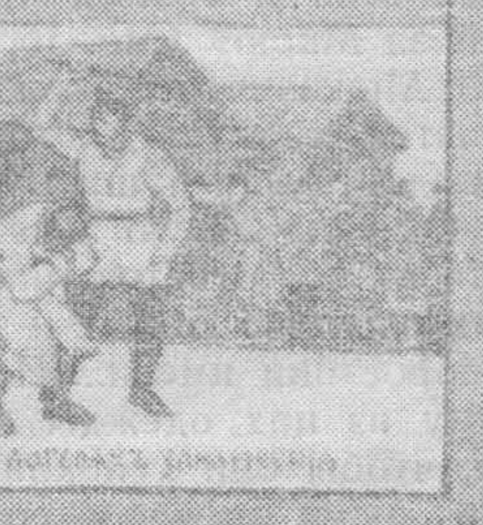
Вспомните святого великомученика Панкратия, который в 306 году в Риме был казнен.