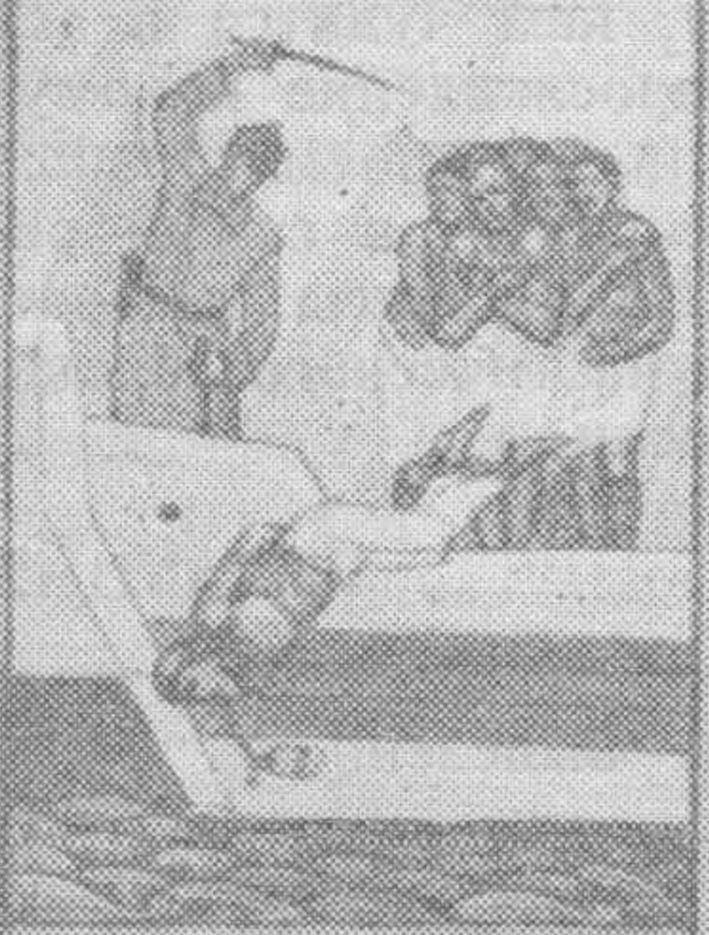
Вспомните святого великомученика Киприана, который в 304 году в Никее был казнен.