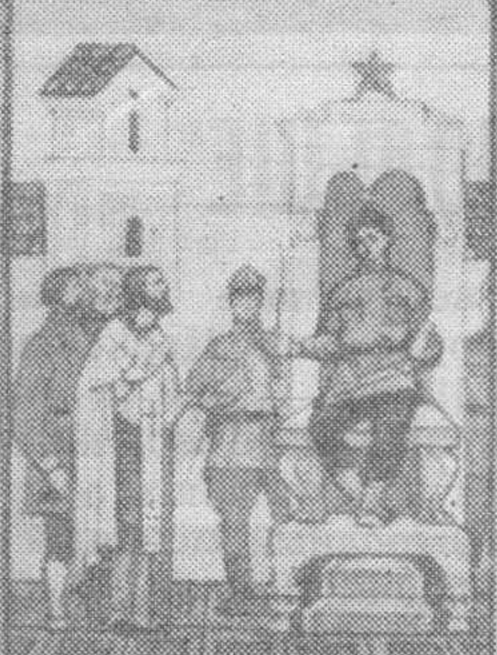
Вспомните святого великомученика Панкратия, который в 306 году в Риме был казнен.