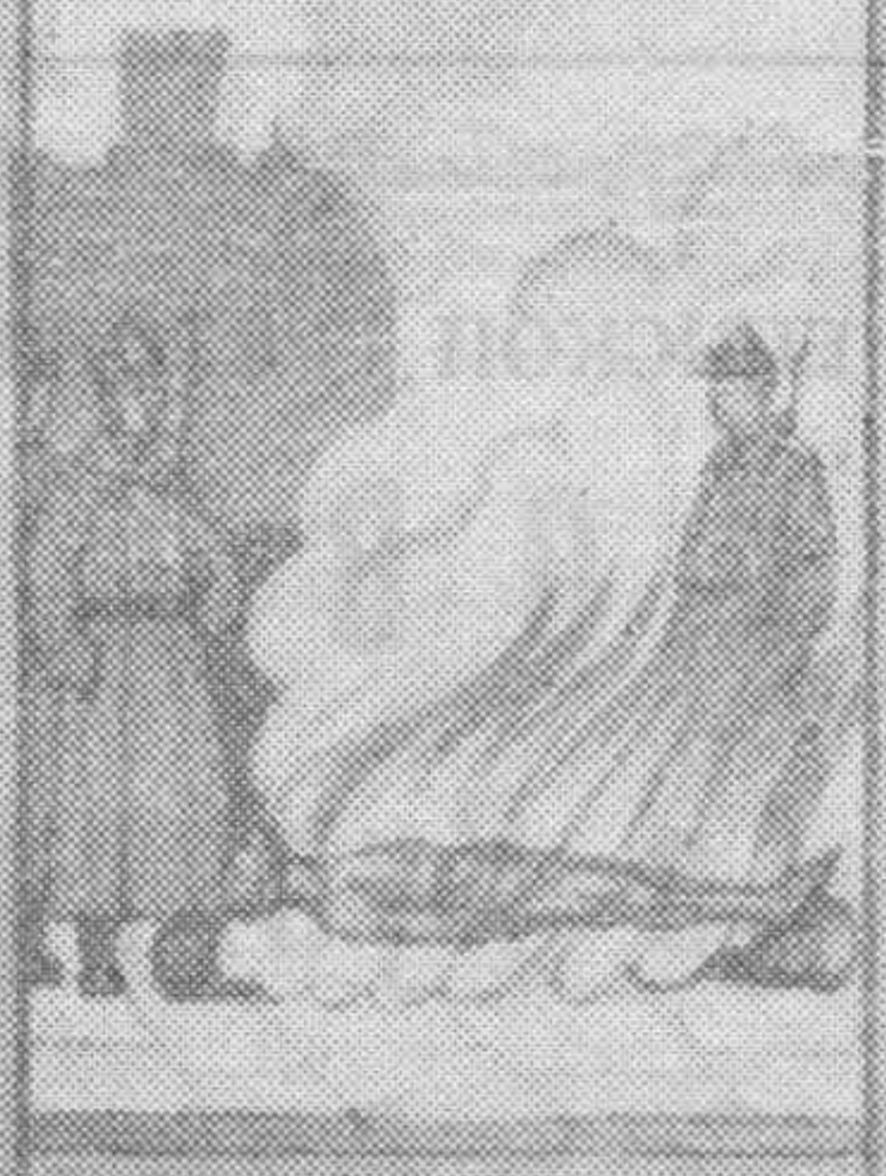
Вспомните святого великомученика Панкратия, который в 306 году в Риме был казнен.