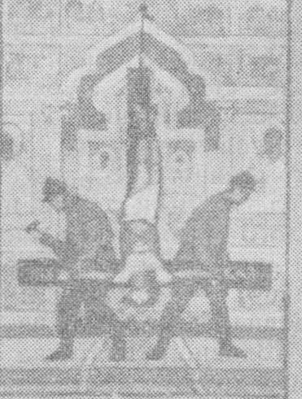
Вспомните святого великомученика Иова, который в 306 году в Александрии был казнен.