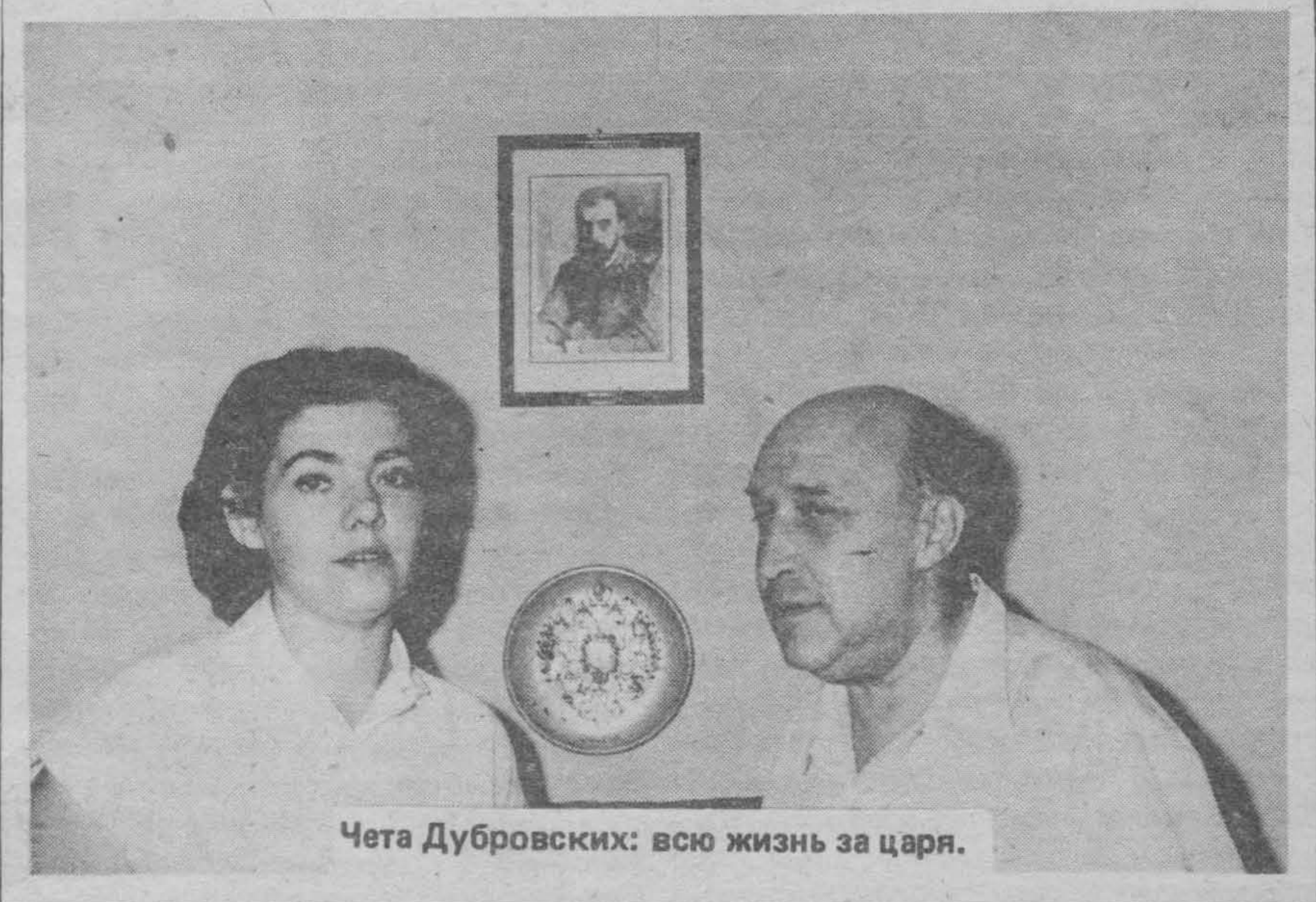
Чета Дубровских: всю жизнь за царя.

Я чувствую, что редакторская деятельность меня очень увлекает и я молю только Бога, чтобы сотрудники были бы активными и разнообразными в своих писаниях. Вот, позавчера, я готовила материал на № 892 и вся дрожала от восторга, что подбирается такой полноценный материал и уже видела перед глазами тот номер газеты, в котором он будет помещен. Я всегда помню и теперь еще больше понимаю Всеволода Константиновича, что он всегда приходил в прекрасное настроение и бывал так доволен и счастлив, когда он составлял номер видел, что статьи подбираются одна другой лучше и предвкушал удовольствие выпуска такого интересного полноценного номера. И у меня по окончании подборки материала для № 892-го вдруг появилось чувство особенного удовлетворения и я почувствовала, что у меня такое радостное и хорошее настроение, что мне даже не было страшно в 11 часов ночи съездить в типографию и отвезти текущую работу и новый материал (типография находится в 20 минутах