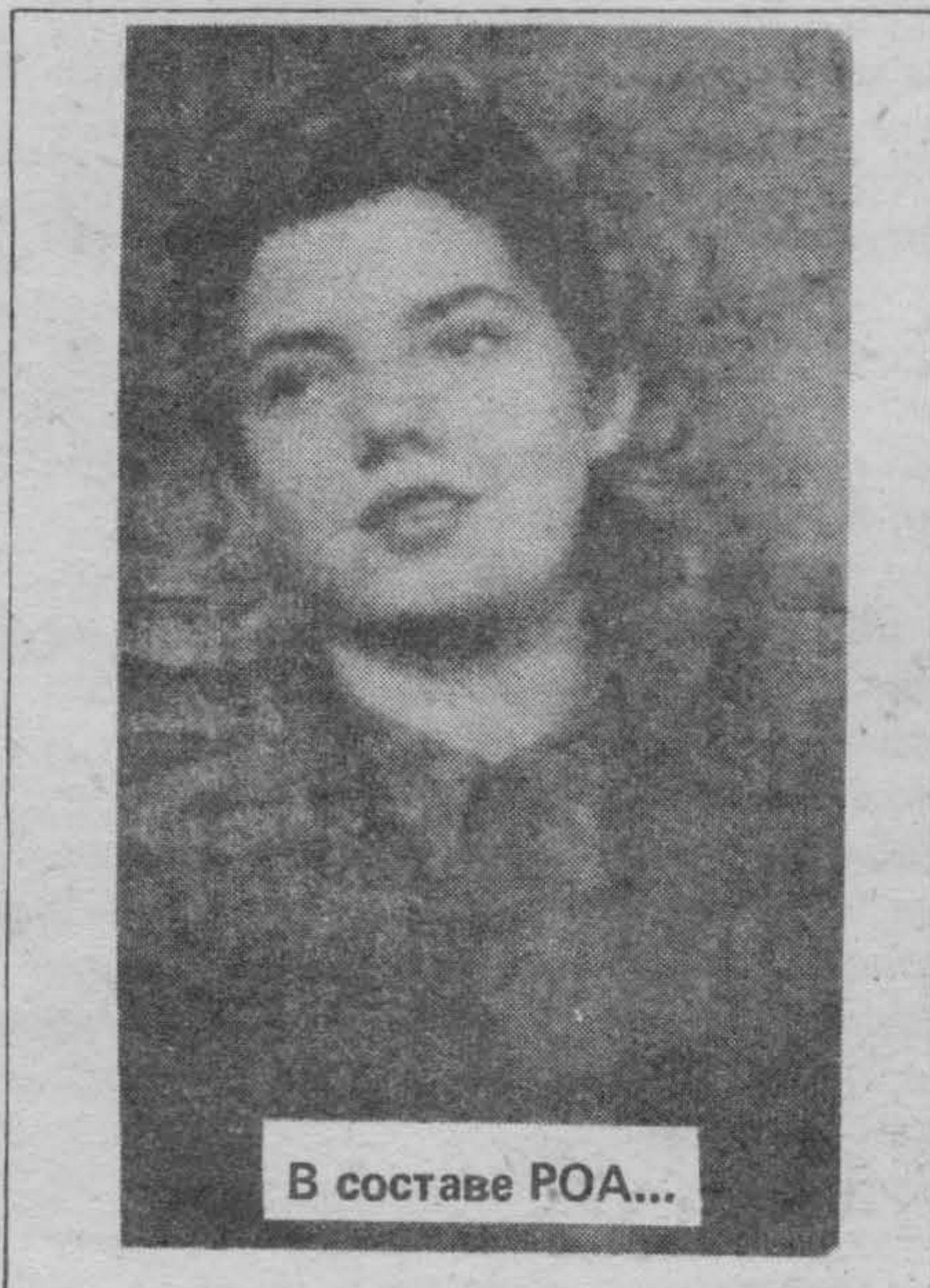
В составе РОА...

Редакторский красный карандаш — извечная тема споров редакторов с сотрудниками. Я еще считаю себя слишком новоиспеченным редактором, чтобы ставить свои какие-то редакторские условия. Но я 20 лет жила бок о бок с настоящим редактором и я восприняла все его редакторские манеры. Совершенно логично, что наряду с опытом и знаниями, которые я впитала от настоящего редактора, я также восприняла и манеру Всеволода Константиновича обращаться с красным карандашом. В течение 18 лет редактирования "Нашей Страны" много раз мы с Всеволодом Константиновичем убеждались, что у