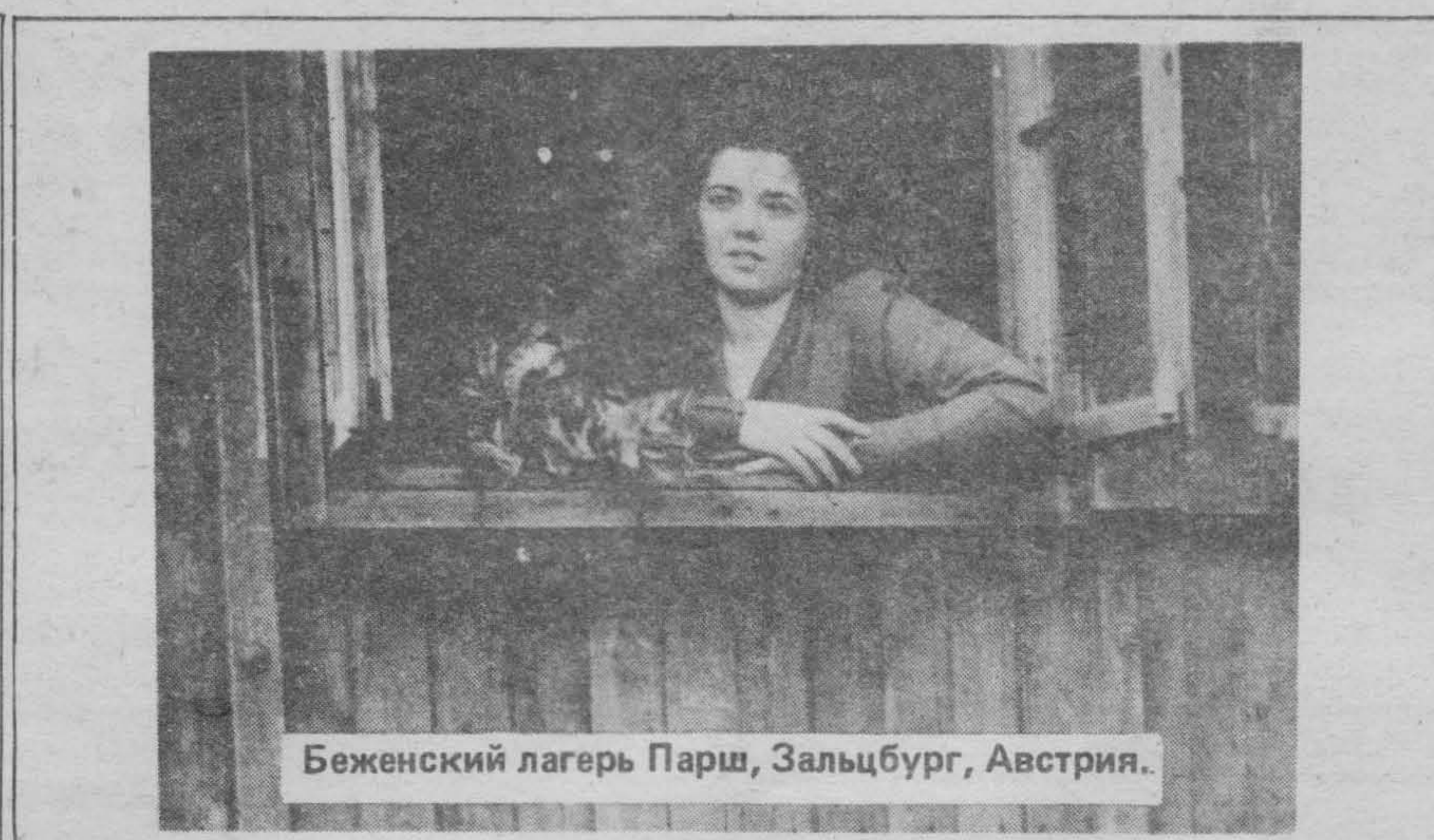
Беженский лагерь Парш, Зальцбург, Австрия.