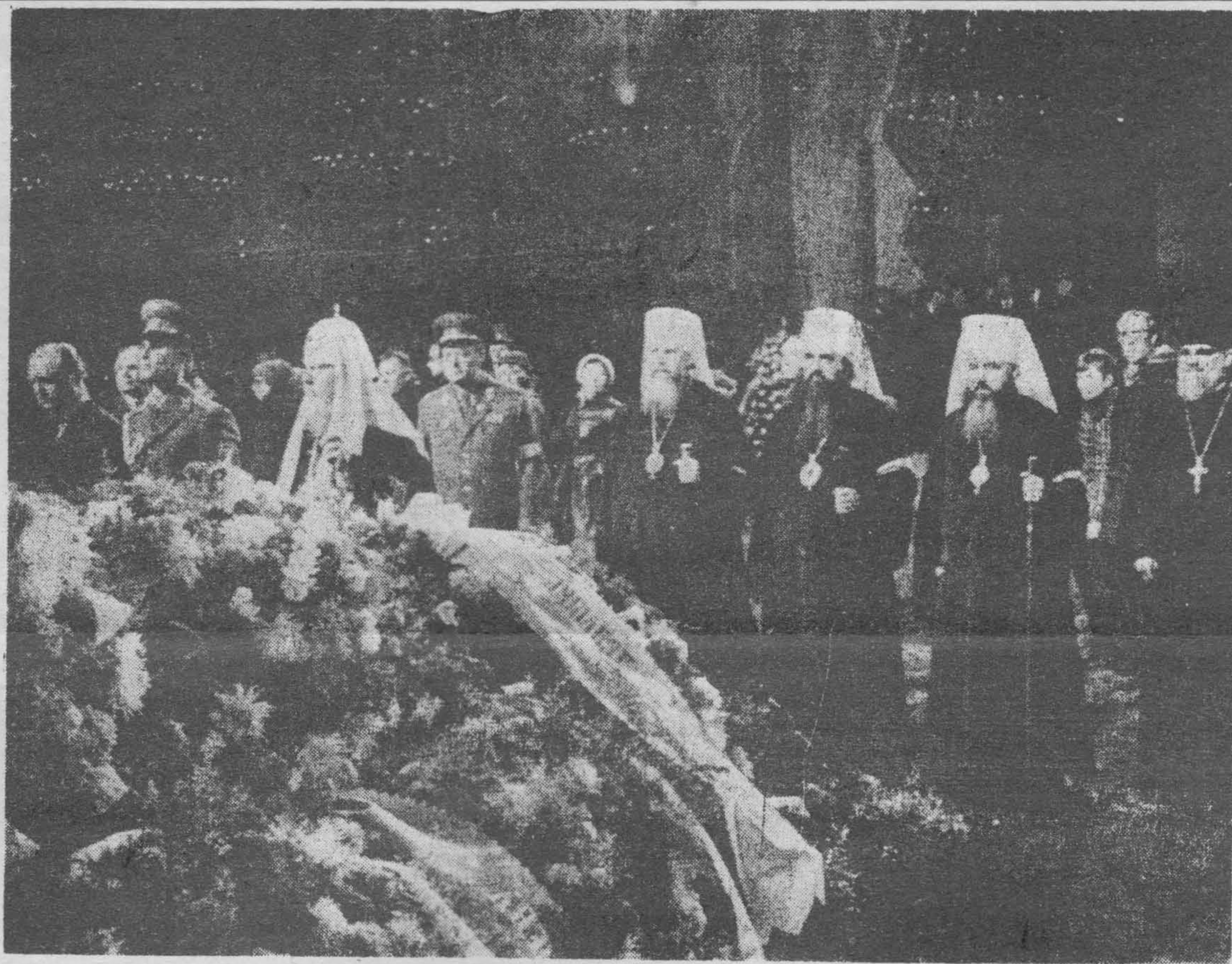
"Под грохот артиллерийского салюта, переключку фабричных гудков и колокольный звон Москва похоронила советского генсека Леонида Брежнева". (Сообщение московских газет).

Но она произойдет от переполнения земли той циничной греховно-