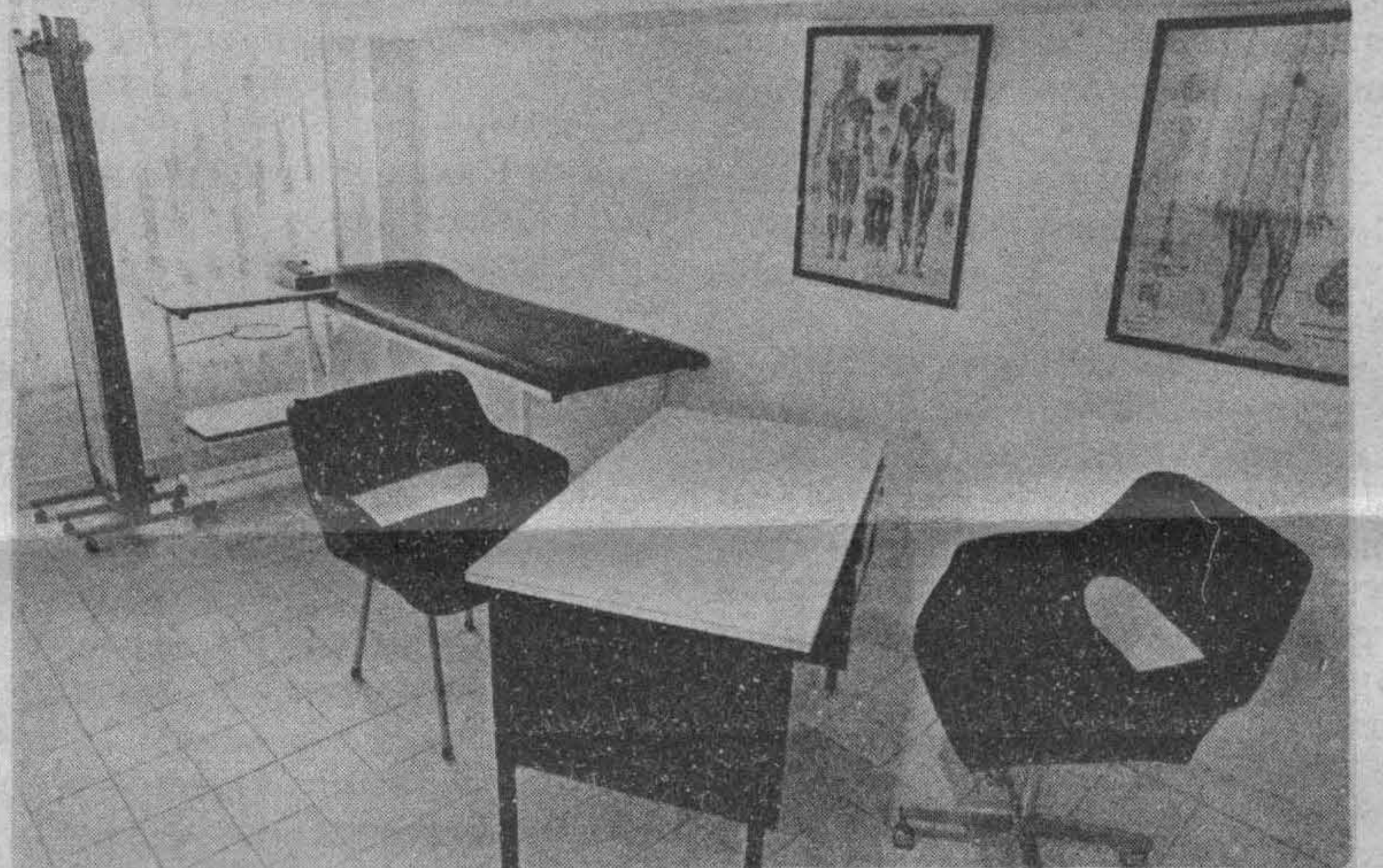
Амбулатория для русских больных всех возрастов

Гости разъехались к 22 часам под большим впечатлением всего виденного и слышанного, так как никто до сих пор не проявил такой всесторонней заботы о престарелых, как Толстовский Фонд. Организация,