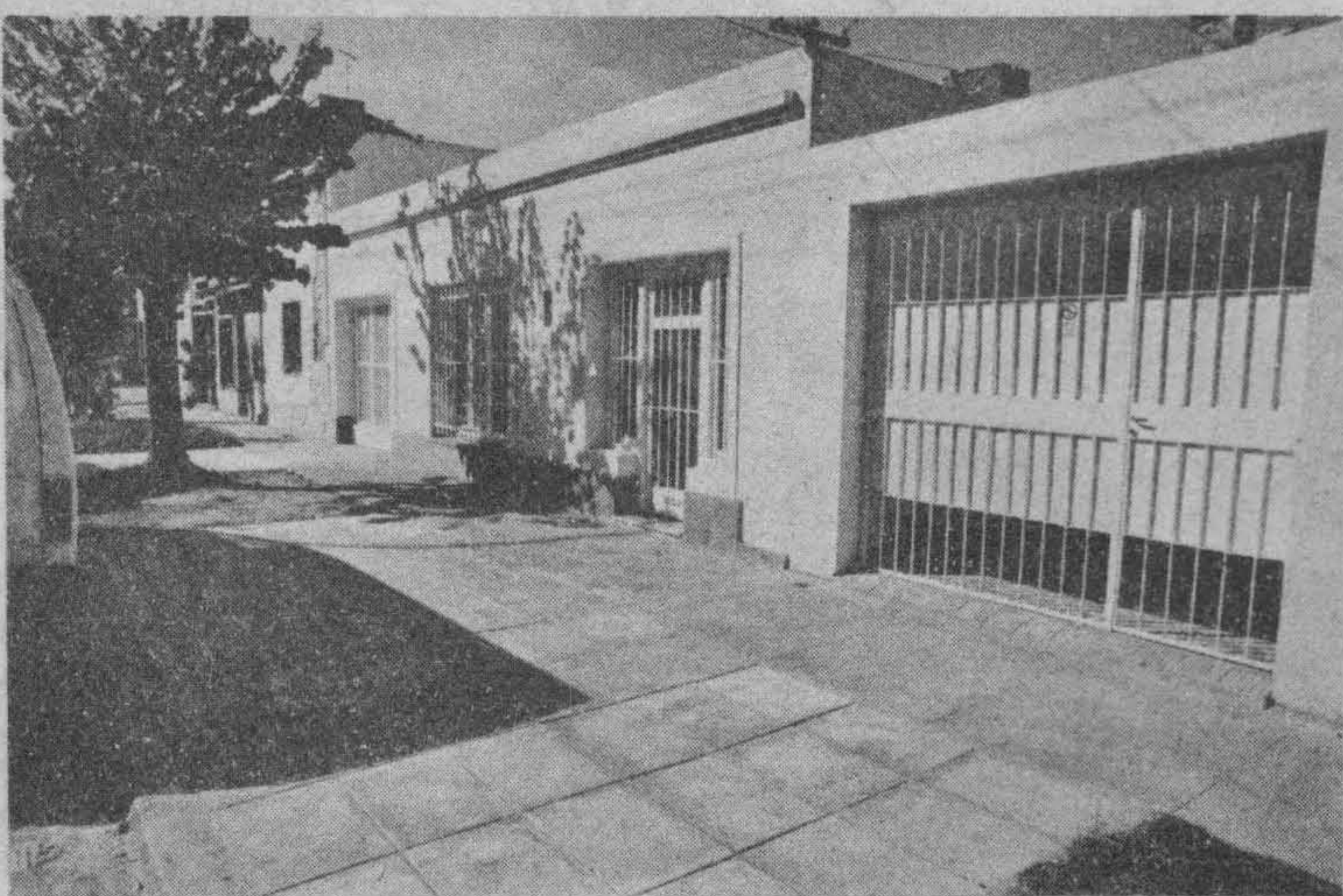
Внешний вид госпиталя для престарелых в буэносайресском пригороде Оливос