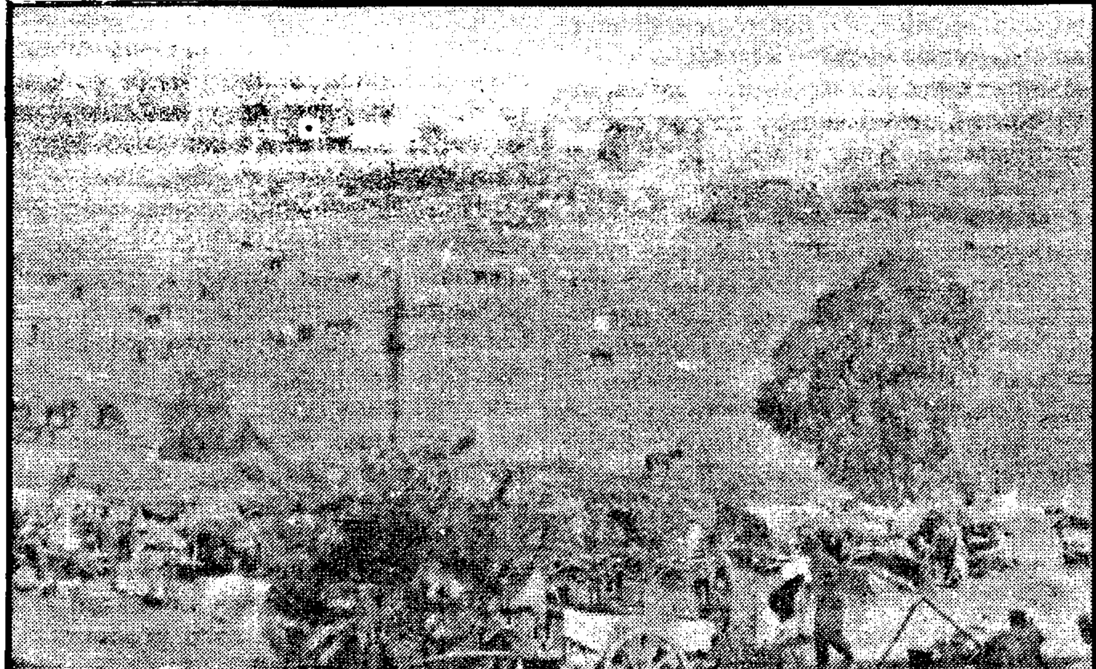
Расположенные в Лиенце казаки накануне выдачи.