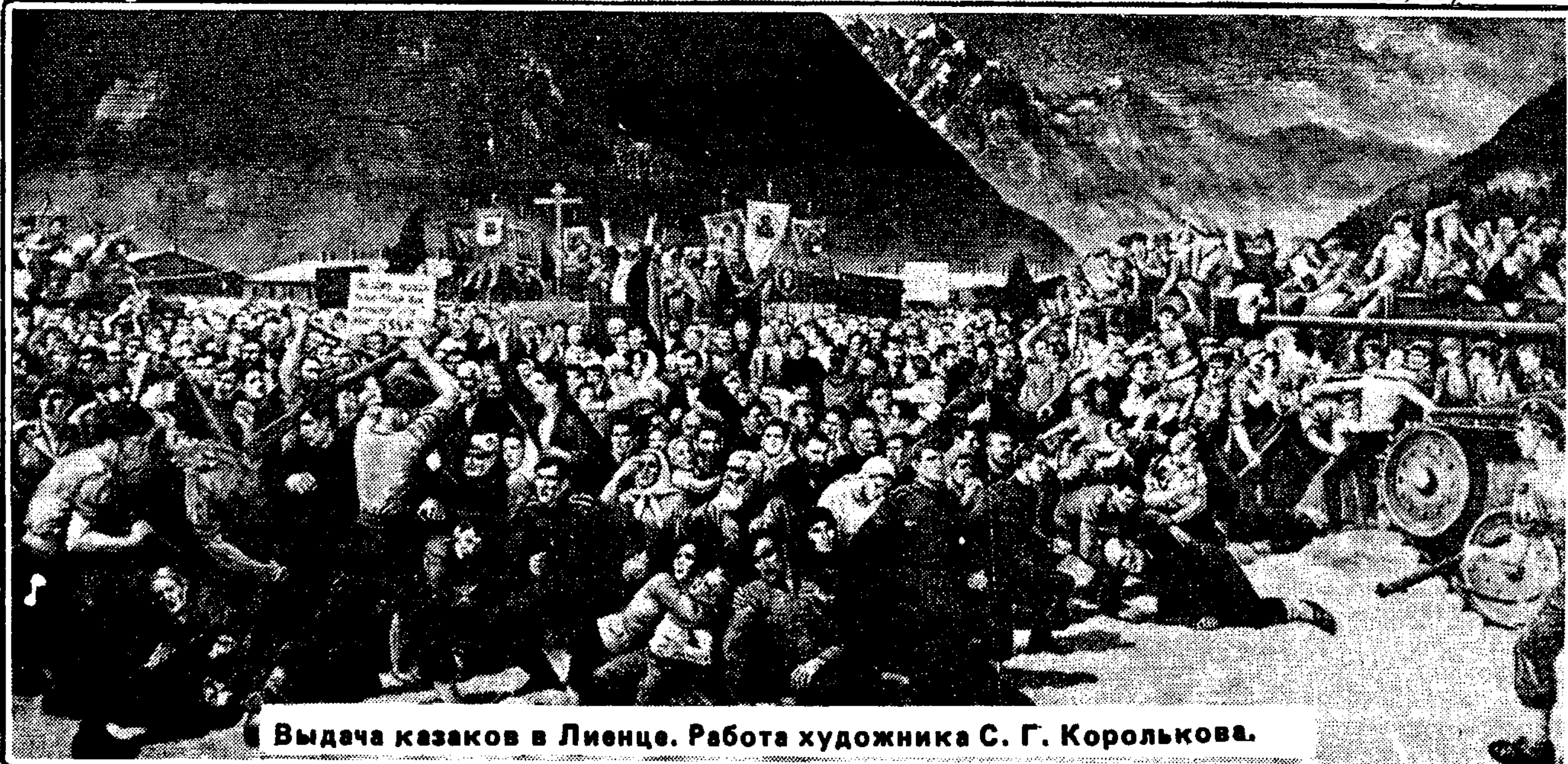
Выдача казаков в Лиенце. Работа художника С. Г. Королькова.