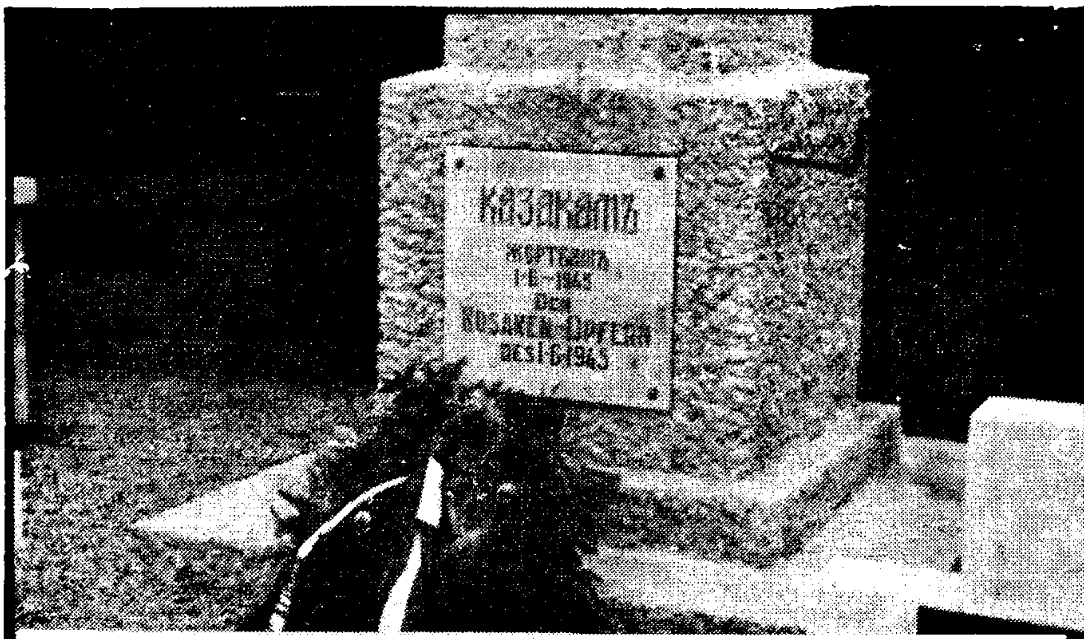
Австрийцы отдают должное жертвам английского предательства.