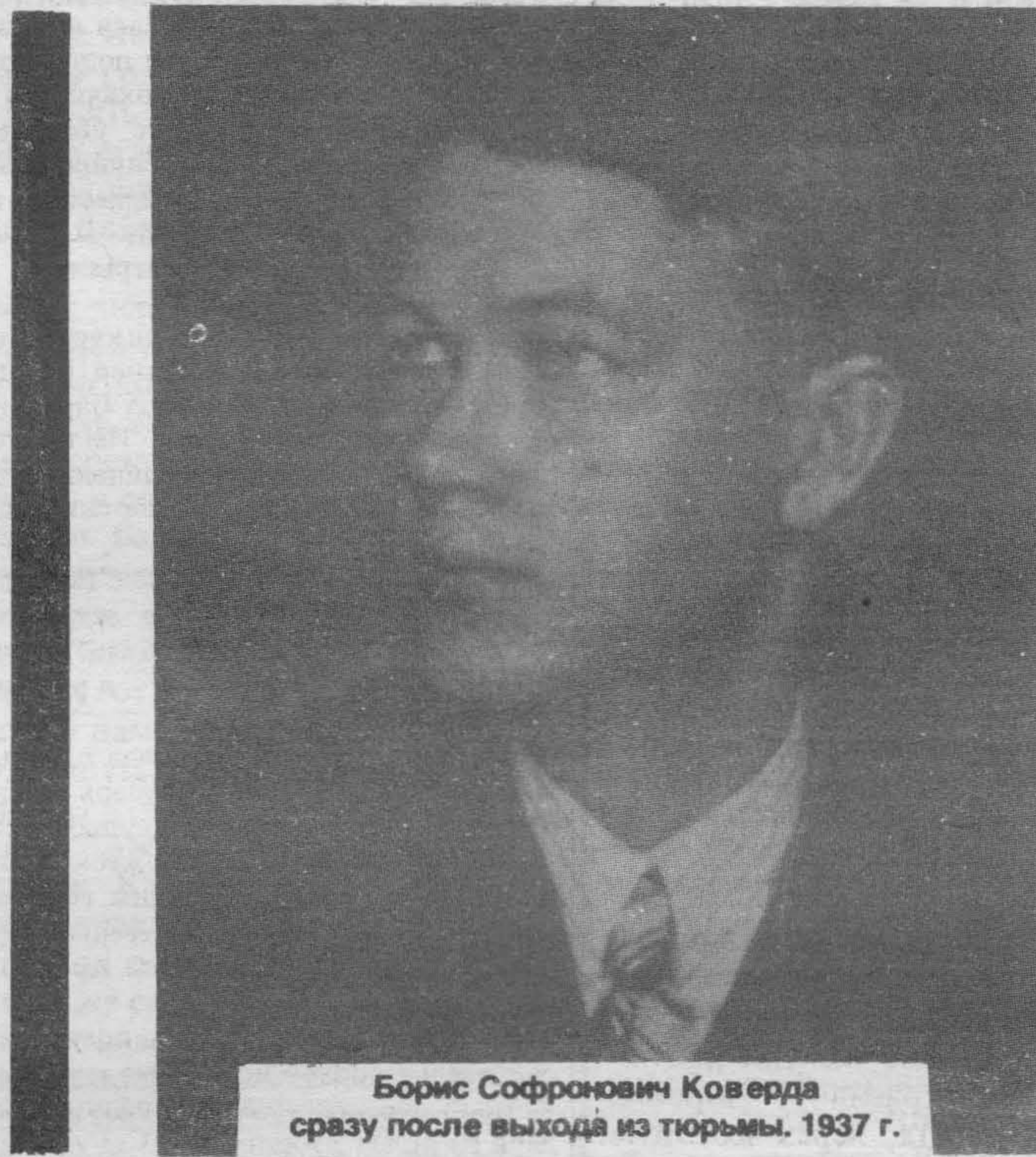
Борис Софронович Коверда сразу после выхода из тюрьмы. 1937 г.

Борис, Борис, Борис Коверда! Ура! Ура! Ура!