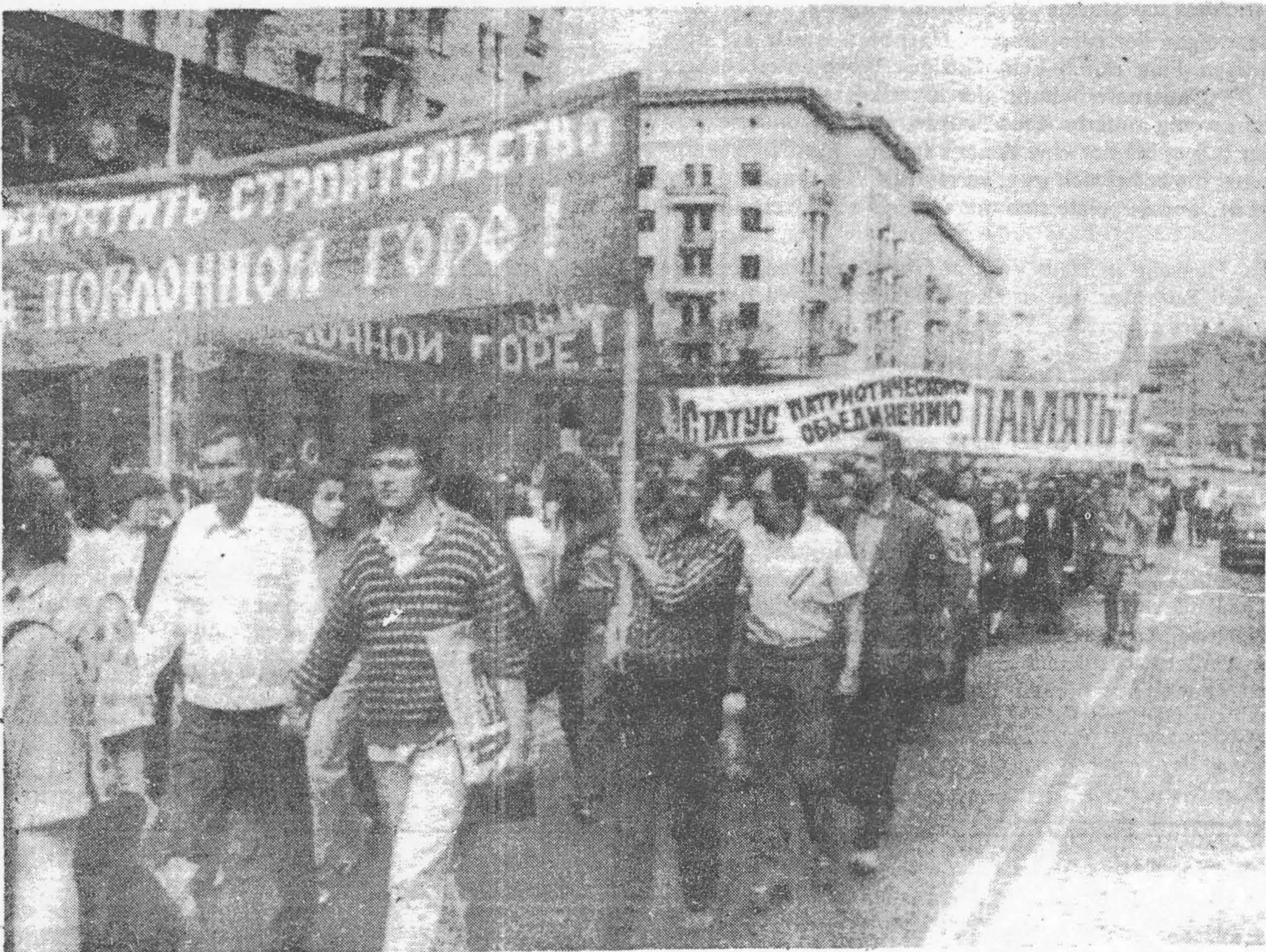
Демонстрация "Памяти" в Москве.