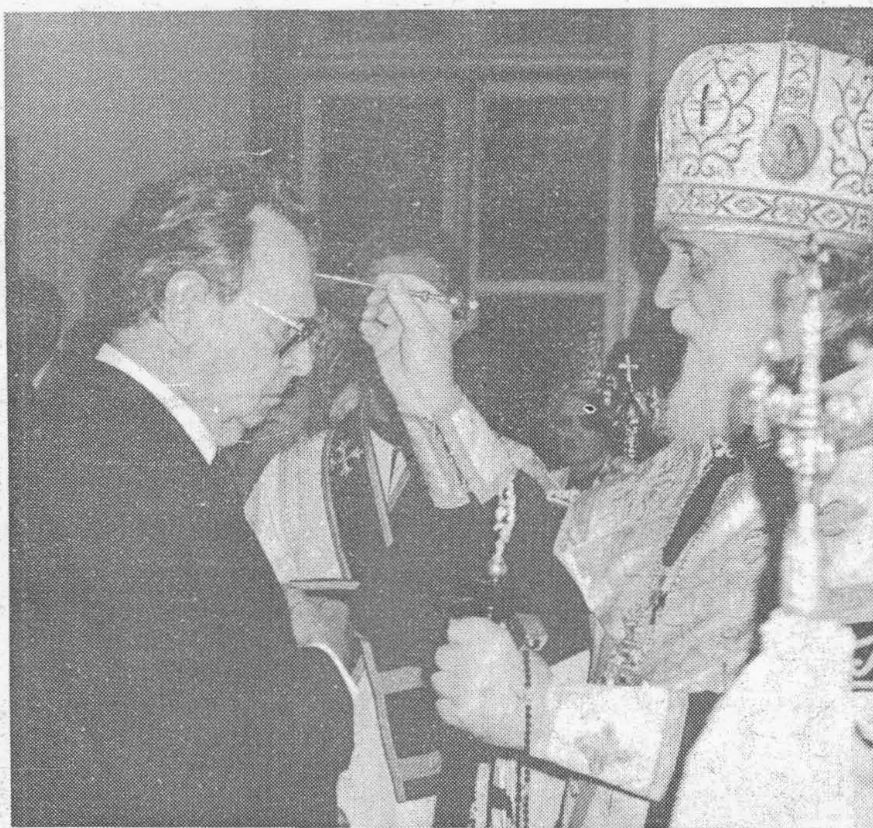
Первоиерарх Русской Православной Церкви Заграницей митрополит Виталий помазывает миром Великого Князя Владимира Кирилловича в Синодальном Соборе.

Как всегда, слово митрополита было содержательным и поучительным. Владыка помянул значение православия в истории России, обрисовал развитие русской культуры на основах христианского учения и указал на правильный путь духовного жития православных людей. Владыка Лавр вкратце рассказал историю строительства храма-памятника на Владимирской Горке и раздал благодарственные грамоты всем потрудившимся при постройке храма и устройстве церковного торжества в