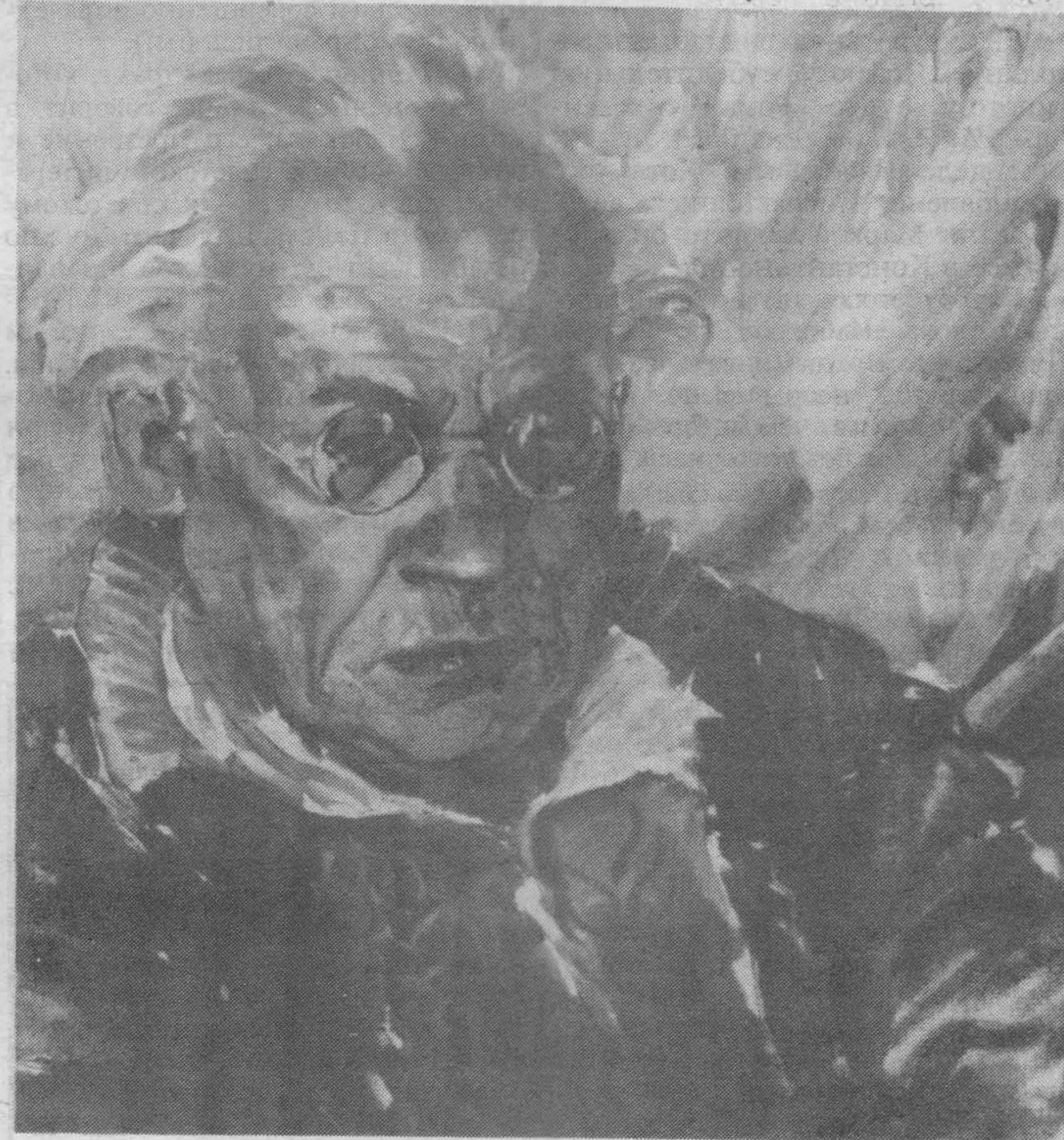
Портрет основателя „Нашей Страны“ работы его сына, художника Юрия Ивановича Солоневича

Исключительная ставка на крестьян могла годиться тогда; но не теперь, когда крестьянство так сильно ослаблено и изничтожено.