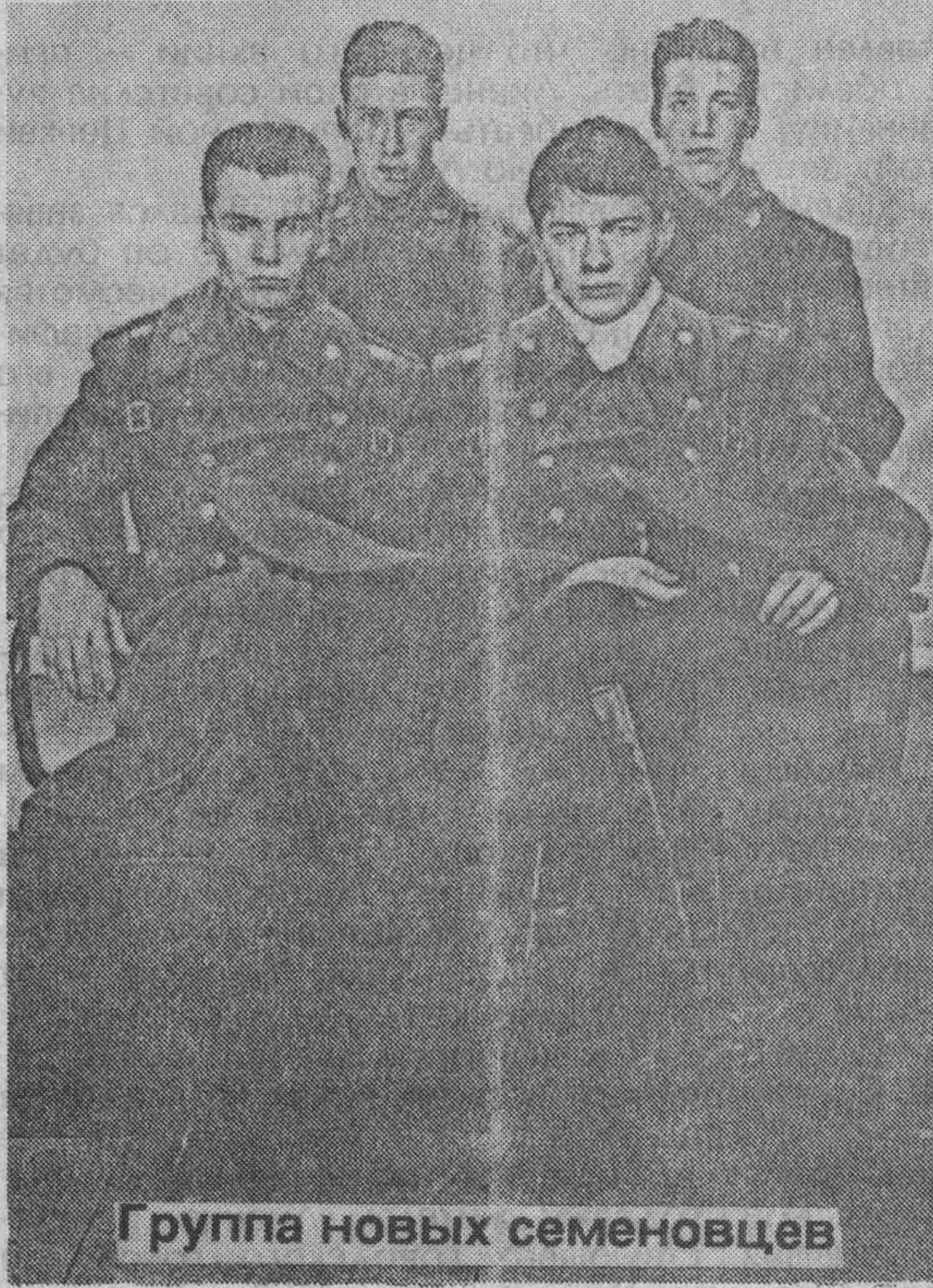
Группа новых семеновцев

Как сообщил выходящий в Сочи «Вестник Лейб-Гвардии» (№ 10), «ныне части Е. И. В. Лейб-Гвардии Семеновского полка снова существуют в России: с 1990 года в Москве — полк, с 1993 года в Туле — запасная рота, с 1992 года в Сочи — запасной взвод, а с 1995 — отдельная команда».