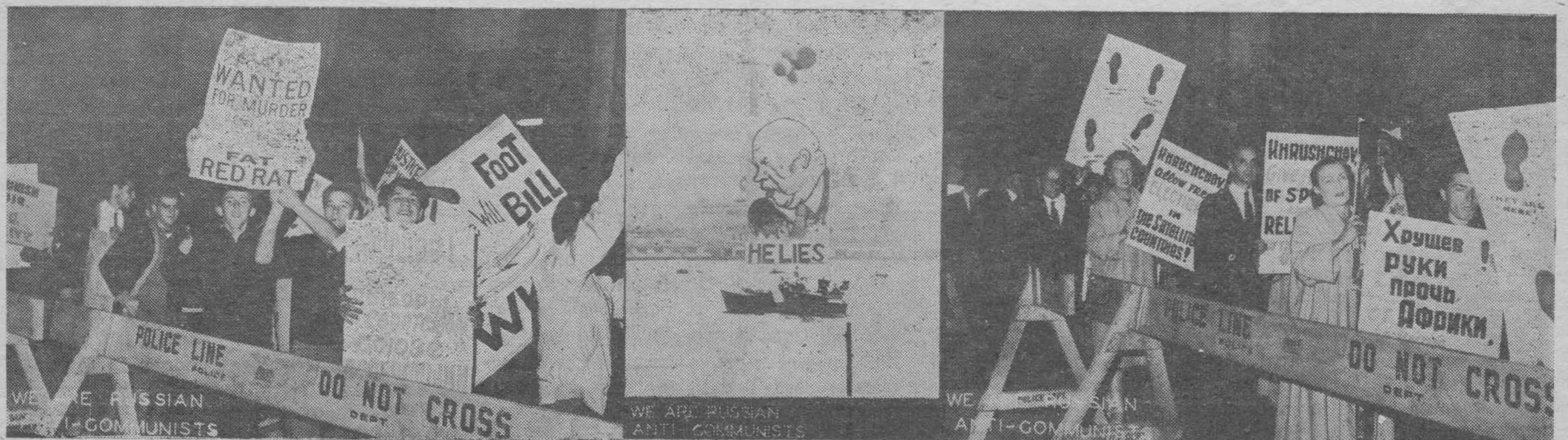
...РУССКИЕ АНТИКОММУНИСТЫ В НЬЮ ИОРКЕ "ПРИВЕТСТВУЮТ" ХРУЩЕВА...

Рим, 5-го октября 1960 г. Алексей Ростов