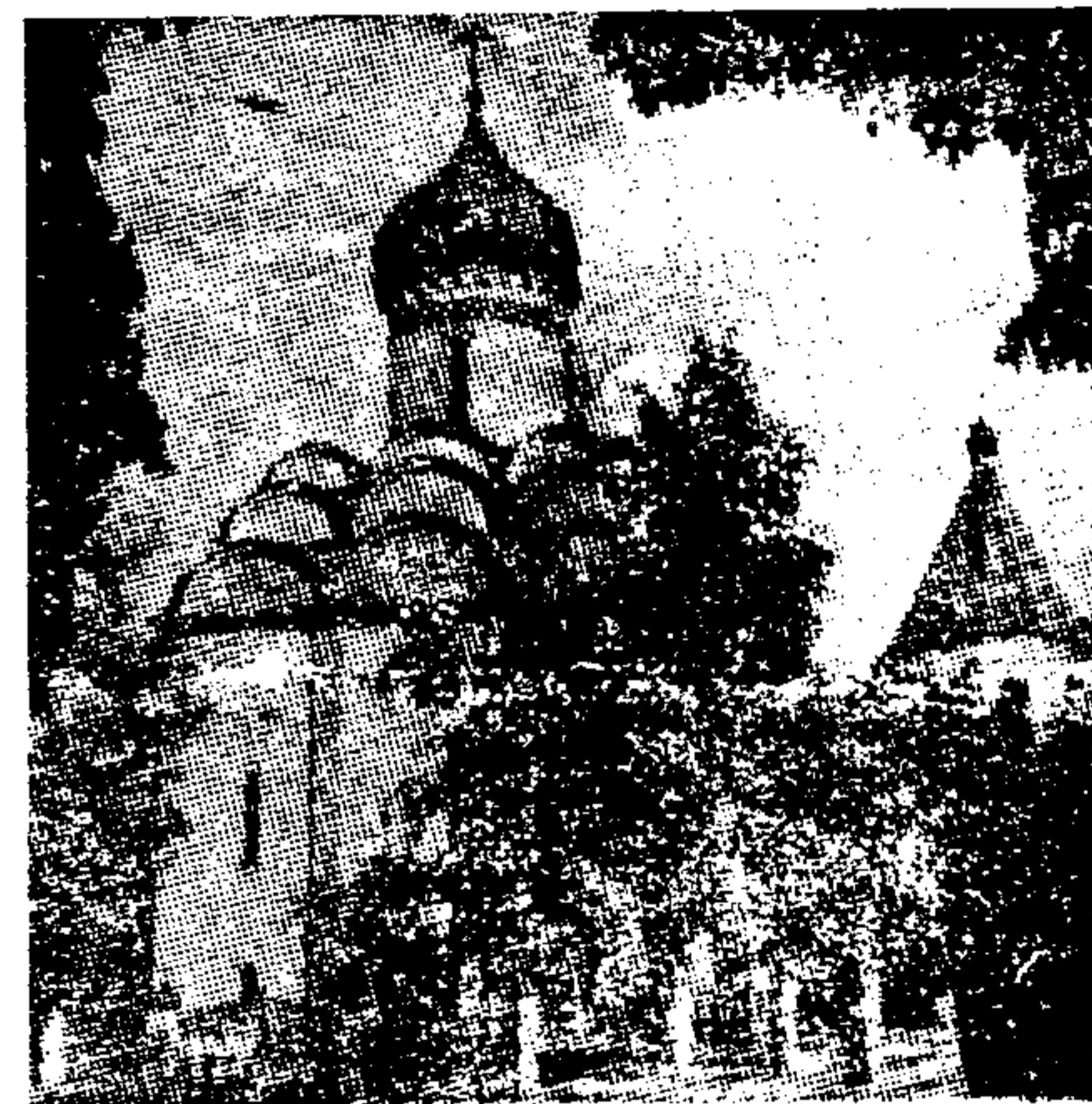
Храм св. Праведного Иова Многострадального в Брюсселе, в Память Царя-Мученика Николая II, Царской Семьи и всех в смуте пострадавших.