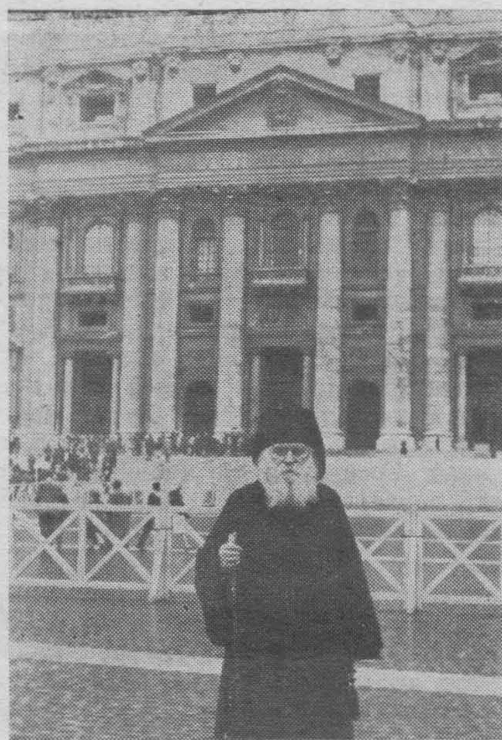
Архиепископ НИКОН на площади перед собором св. Петра в Риме

Проездом в Святую Землю Секретарь Архиерейского Синода Высокопреосвященный Никон Архиепископ Вашингтонский и Флоридский пробыл в Риме с 26-го по 30-е марта.