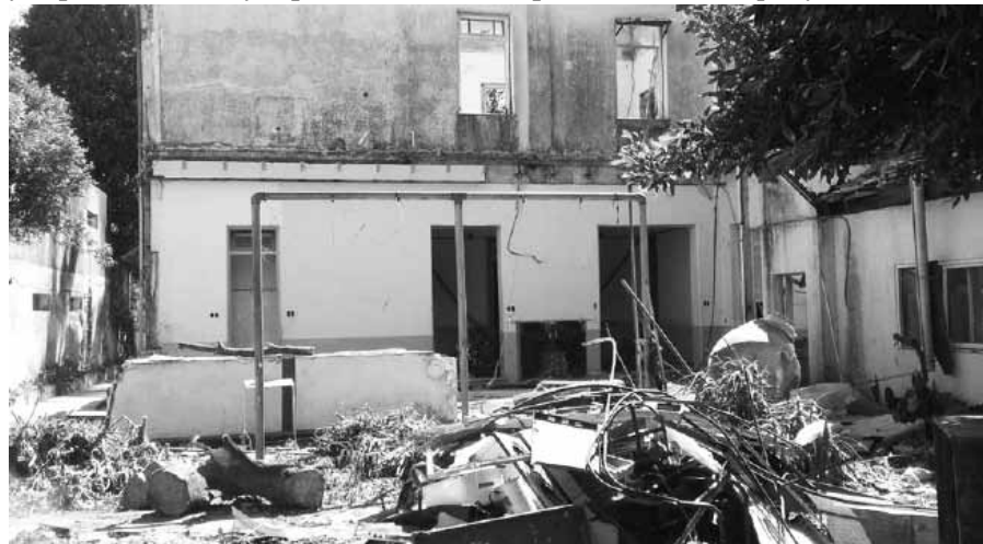
Грабительство. Вид из заднего угла участка Корпусного Дома в Вижа Бажестере.

Разумеется, продав дом, нужно было бы отделить некую сумму денег для пожизненного содержания в другом старческом доме имеющих теперь у нас теперь трёх белых насельников