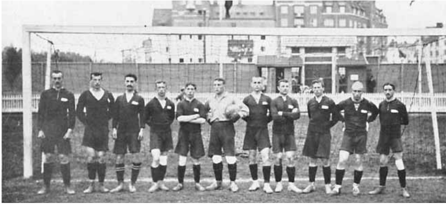
Сборная Российской Империи на Олимпийских Играх 1912 года