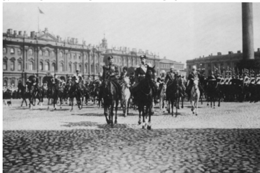
Император Николай Второй с императором Францем-Иосифом на Дворцовой площади в 1897 году.

Автократическую систему Рос-сии эрцгерцог считал достойной подражания. Такой государственный организм как Австрия, наподобие мозаики, сотканной из целого ряда народностей, должен был по его мнению управляться крепкой рукой. По теории эрцгерцога, Австрии нужно было искать сближения с государствами, соблюдающими монархический строй, а не с режимами, испо-ведующими противоположную форму правления. С другой стороны