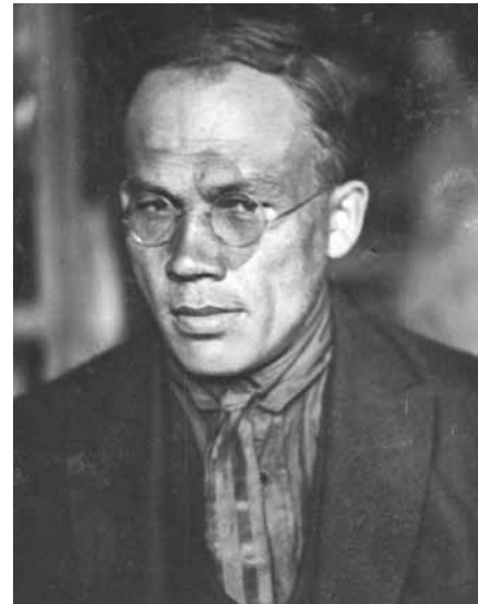
И. Солоневич накануне ареста