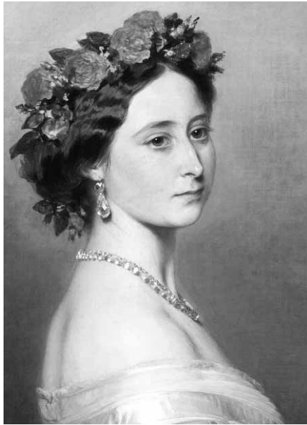
Принцесса Алиса Гессенская, мать Государыни Императрицы Александры Фёдоровны

Герцогиня была образцовой матерью и женой, и вся её частная жизнь вращалась вокруг семьи. Посещая госпитали и богадельни, герцогиня часто брала с собой своих детей и там они раздавали подарки страждущим и обездоленным. Этими посещениями герцогиня старалась возбудить и развить в своих детях чувства сострадания и любви к ближнему.