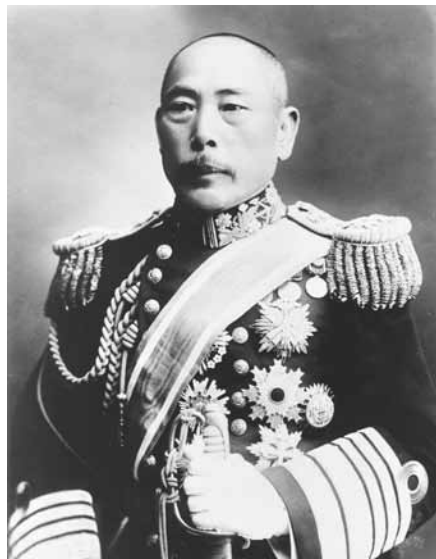
Адмирал Камимура Хиконодзэ

Лишние люди были отпущены от орудий и им розданы койки.