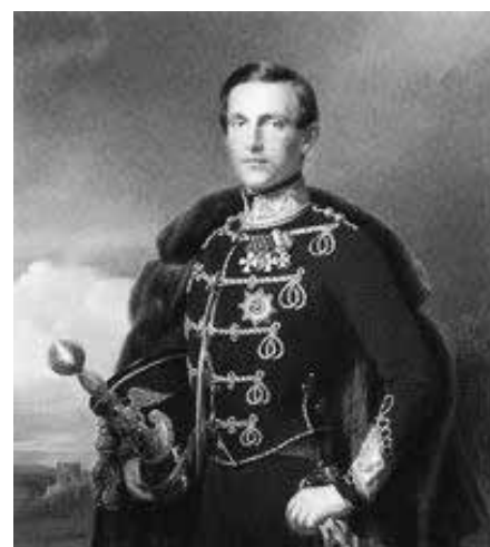
Великий Князь Константин Николаевич

Эта покупка вошла в историю Америки как Gadson Purchase, то есть носила имя американского министра, отосланного в Мексику для заключения этой сделки.