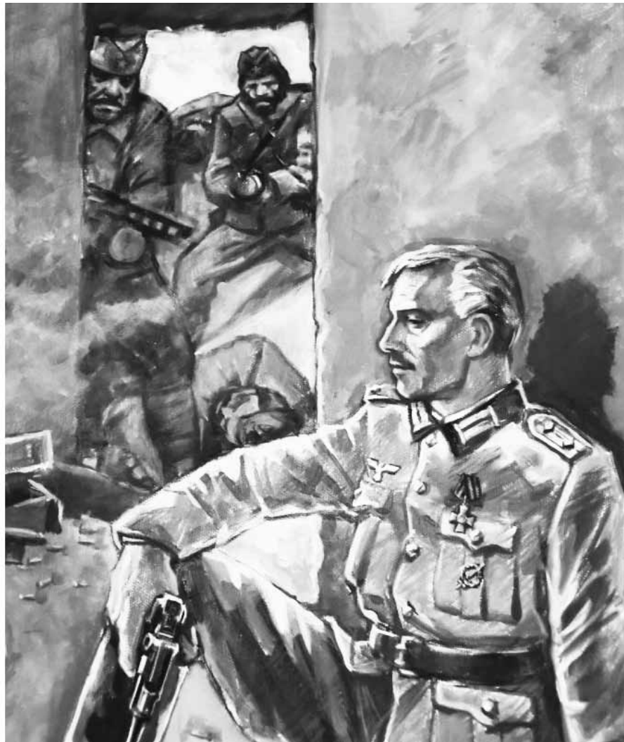
В 1941-1945 гг. миллионы русских попытались использовать немцев для освобождения от коммунизма, сражаясь в рядах таких патриотических формирований, как Русский Корпус на Балканах.

В настоящий момент в РФ сформировался уже квази-религиозный