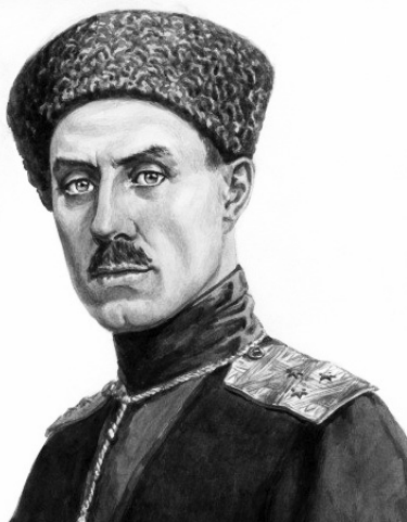
Врангель против Вацетиса