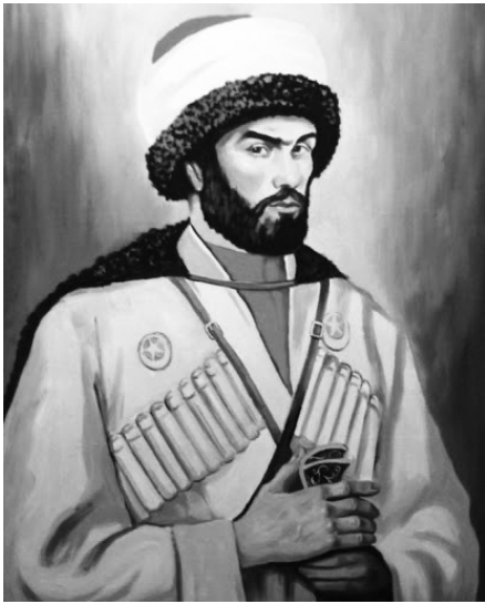
Аварский вождь Хаджи-мурат, правая рука имама Шамиля

После гибели в 1832 году Казимуллы, имама Дагестана, вторым имамом, его преемником стал Гамзат-бек. Ему удалось пополнить расстроенные ряды мюридов и, собрав их, избегая крупных столкновений с русскими, овладеть Аварией, предварительно убив коварным образом двух сыновей доблестной ханши, состоявшей в союзе с Россией, заманив их в свой стан. Гамзат-бек по своей натуре был настоящим абреком-разбойником. Правил он недолго, около двух лет и закончил свой жизненный путь бесславно, как и жил, став жертвой кровной мести, которую сам затеял.