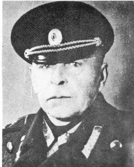
Генерал Б. А. Штейфон

Чины Русского Корпуса постоянно стремились попасть на Восточный фронт – освободить Россию от коммунистов. Они надеялись, что солдаты Красной Армии, вчерашние рабочие и крестьяне в серых шинелях, узнав, что перед ними стоят не германцы – а русские части,