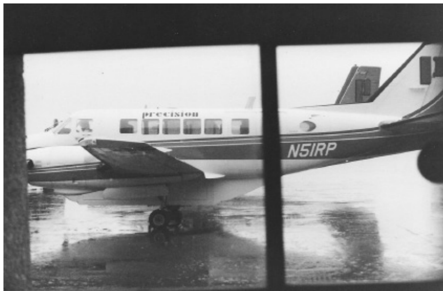
На этом самолётике, в дождик, я летел к А. И. Солженицыну

Разумеется, я не согласился на оплату писателем моего проезда. Моё посещение Солженицына в Вермонте описано мною в "Нашей Стране" № 2850 от 23 августа 2008 года.