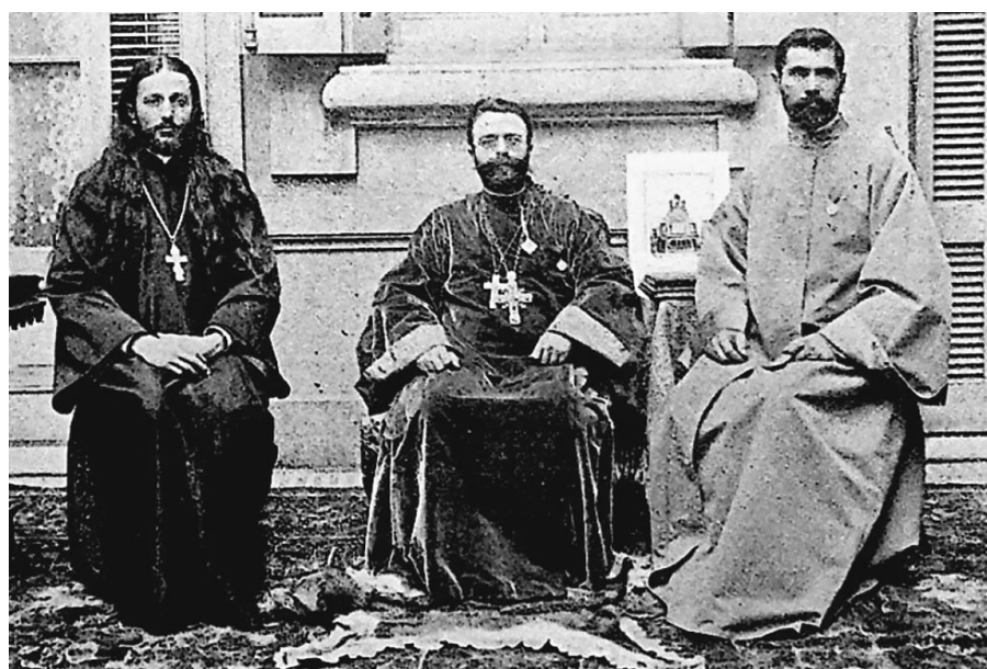
“Апостол православия в Южной Америке” протопресвитер Константин Изразцов