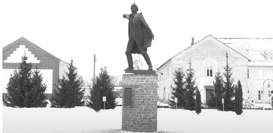
Полтава: перенесённый из Киева памятник А. В. Суворову