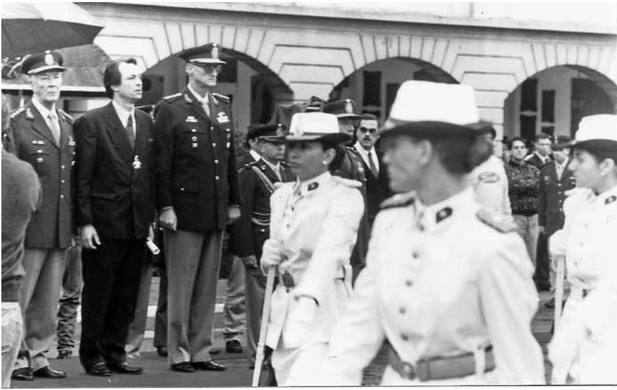
Награждён орденом за Мальвинскую кампанию и принимаю парад вместе с главнокомандующим аргентинской армии. 1995 год.