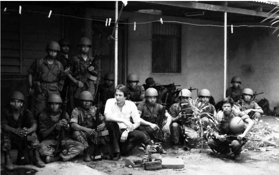
С солдатами Национальной Гвардии, воюющей против красных-сандинистов во время гражданской войны в Никарагуа. 1979 год.