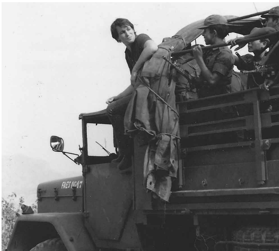
С солдатами Эль Сальвадора, в поисках красных партизан по горам Чалатенанго. 1980 год.