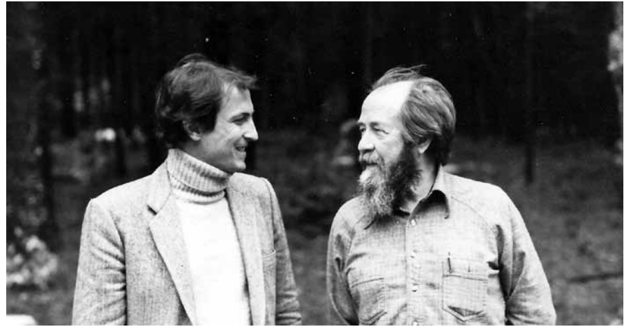
Сбылась мечта. Посетил Александра Солженицына в Кавендише, штат Вермонт, и услышал из его уст, что он монархист. 1984 год