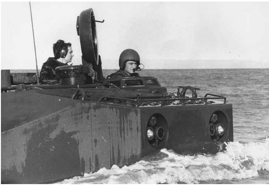
На борту амфибии аргентинского военно-морского флота в Атлантическом океане. 1974 год.