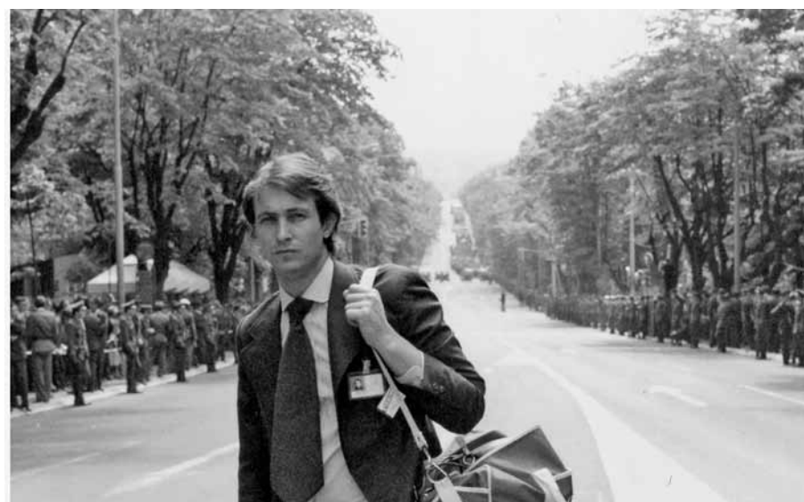
Белград, 1980, на похоронах Тито. В передаче из Югославии мне удалось рассказать о борьбе Русского Корпуса против титовцев.