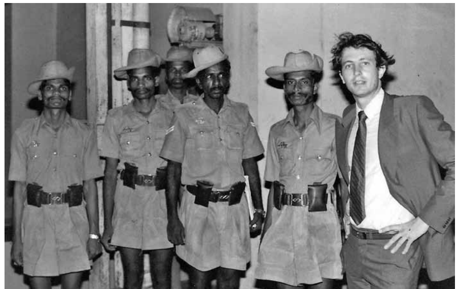
С местными солдатами в городе Мадрас, Индия. 1980 год.