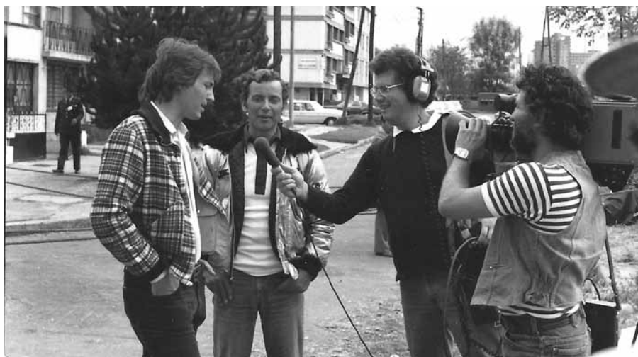
Колумбия, 1980. У меня берёт интервью американская телевизионная сеть, по поводу захвата красными партизанами посольства Доминиканской Республики в городе Богота.