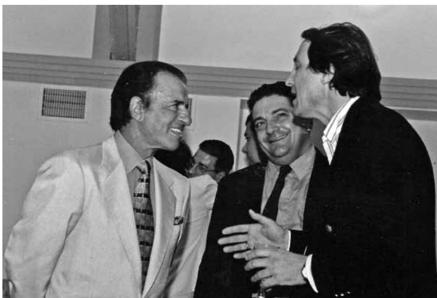
Рассказываю анекдот аргентинскому президенту К. Менему. 1997