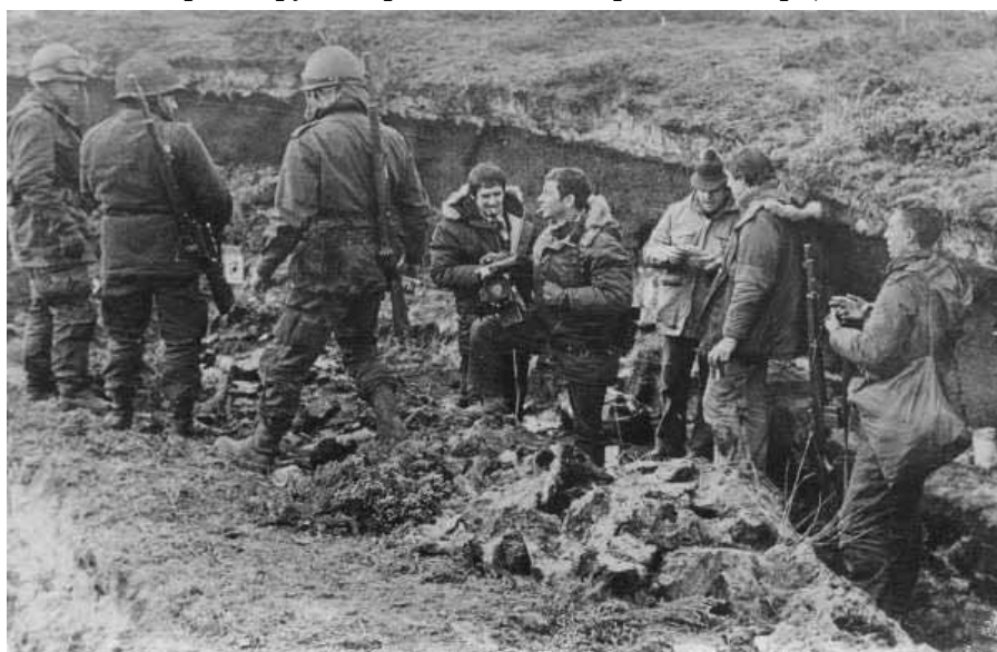
С аргентинскими солдатами, ожидая очередную английскую бомбёжку. Я - второй справа. На Мальвинских островах, 1982 год.