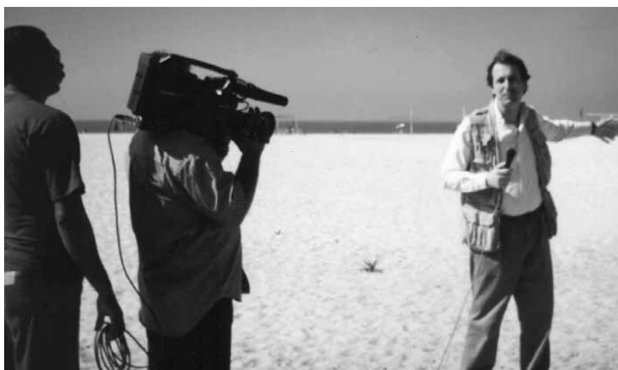
На райском океанском побережье Рио де Жанейро, Бразиль. 1997