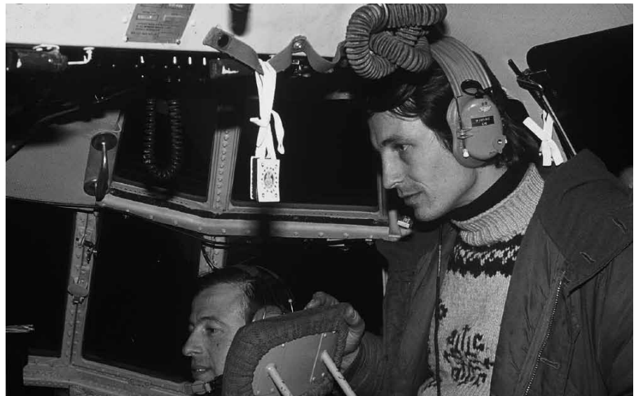
На прорывавшем английскую блокаду, и вылетевшем с Мальвинских островов под огнём, последнем самолёте Геркулес С-130. Ночь с 13-го на 14-ое июня 1982 года.