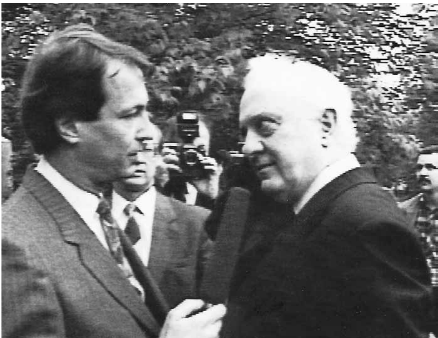
Эдуард Шеварднадзе зло на меня смотрит, ибо я интервьюирую его нахрапом, прямо на улице, и задаю неудобные вопросы. 1991