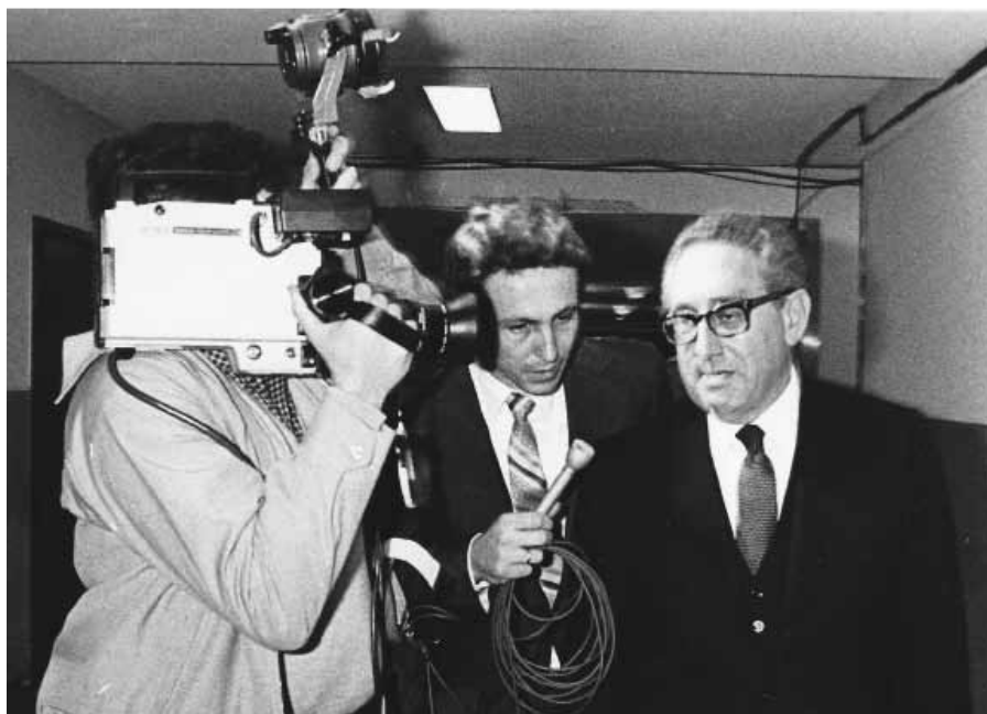
Интервьюируя нахрапом Киссингера. Нью Йорк, 1980