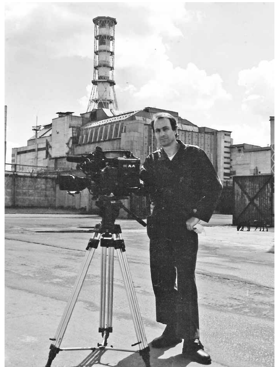
Чернобыль, 1998 год. Вёзший нас шофёр уверял меня, что ради безопасности необходимо выпить бутылку водки прежде, чем отправляться туда. Но на всём протяжении дороги из Киева мы так и не обнаружили ни одного магазина. А молодой инженер, каждый день залезавший под реактор чтобы мерить радиоактивность, говорил мне, что она не берёт тех, кто её не боится.