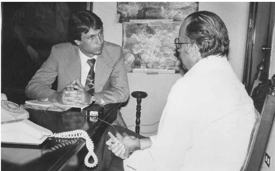
Интервьюируя никарагуанского диктатора Анастасия Сомосу. Манагуа, 1979 год. Его позже убьют красные в Парагвае.