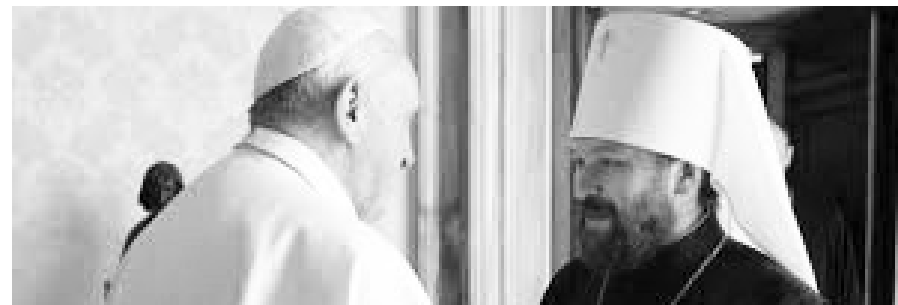
Митрополит Иларион Алфеев и римский папа Франциск

В 2008 году его кандидатура была выдвинута на пост главы Православной Церкви Америки, но он отказался, когда появилась критика его прошлой работы, сказав что это положение должно быть занято американцем. 31 марта 2009 был назначен епископом