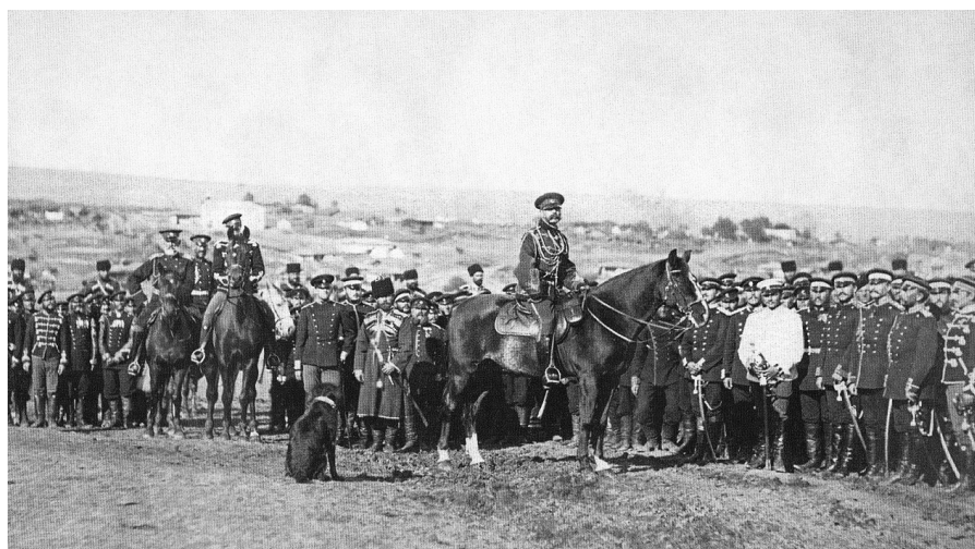
Император Александр Второй во время осады Плевны