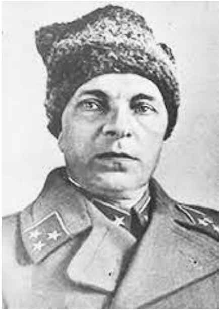
Советский генерал М. Ф. Лукин

Показательные были сказаны 12 декабря 1941 года попавшим в немецкий плен советским генерал-лейтенантом М. Ф. Лукиным допрашивавшему его переводчику капитану В. К. Штрик-Штрикфельдту: