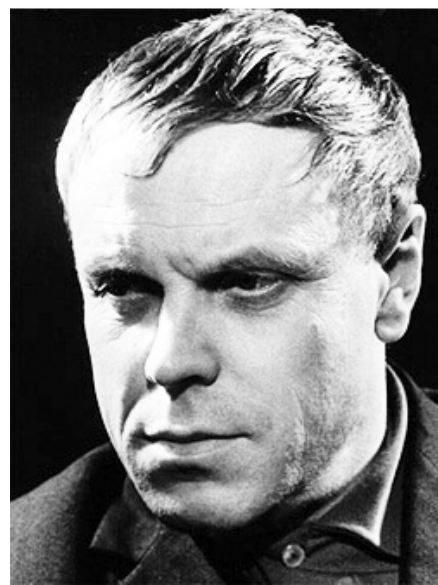
Писатель В. А. Солоухин

Итак, если у Вас в будущем будет возможность дальше помогать «Нашей Стране», то высылайте чеки на мой адрес – как было прежде. И также скажите, выслали ли Вы помощь в этом году или нет.