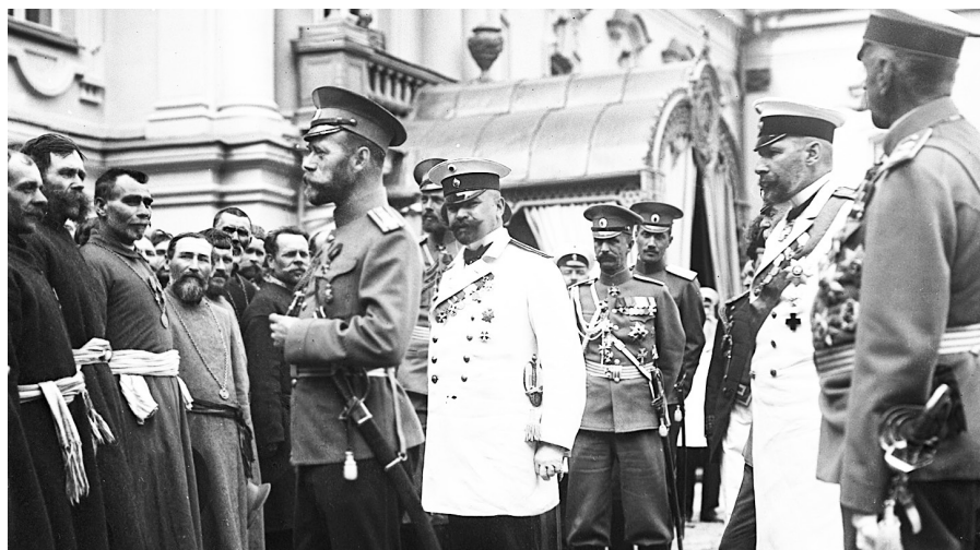
Государь Император Николай Второй в сопровождении премьера Петра Аркадьевича Столыпина (второй справа)