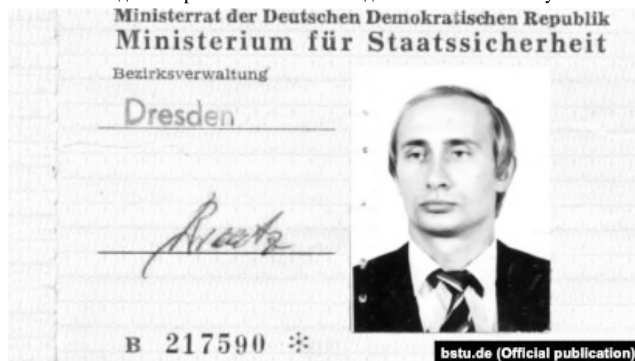
Дрезденский связной ЧЕКА-КГБ Владимир Путин, специалист по отравлениям ядом.

Социологи также выяснили, как россияне относятся к идее строительства музейного комплекса, который предлагается назвать «Сталин-Центр». О таких планах в апреле объявило отделение КПРФ в Нижегородской области. 60% опрошенных ответили, что полностью поддерживают (26%) или скорее поддерживают (34%) эту идею.