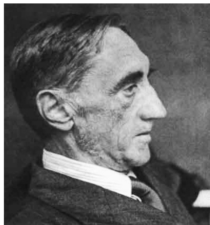
Иван Сергеевич Шмелёв, автор романа "Лето Господне"

«С крыш уже прямо льет, и на заднем дворе <...> начинает копиться лужа — верный зачин весны. Ждут её — не дождутся вышедшие на волю утки <...> Смотрю и я: скоро на плотике кататься. Стоит и Василь Василич, смотрит и думает, как с ней быть. Говорит Горкину: