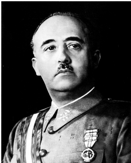
Спаситель Испании от коммунизма генерал Франсиско Франко

В научных и общественных кругах Испании ведётся полемика вокруг восприятия событий, связанных с антикоммунистическим восстанием генерала Франсиско Франко 1936 года и последовавшей за ней Гражданской войны.